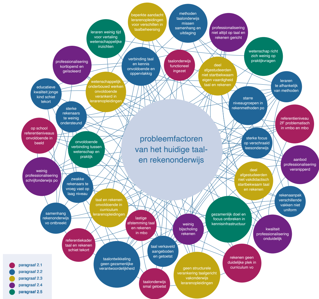
Figuur 3. Illustratie van de veelheid en verwevenheid van de probleemfactoren van het huidige taal- en rekenonderwijs

De figuur is puur illustratief en op hoofdlijnen. De omvang van de bollen is niet gerelateerd aan de omvang van de probleemfactor.