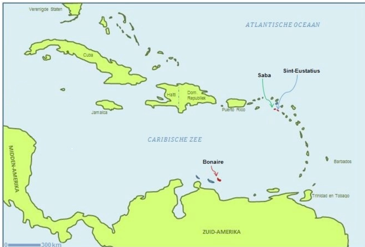
Figuur 2 Ligging Bonaire, Sint Eustatius en Saba in het Caribisch gebied

Bonaire, Sint Eustatius en Saba liggen alle drie in het Caribisch gebied en hebben alle drie dezelfde positie en taken als openbaar lichaam. Voor het berekenen van referentiekosten voor de eilandelijke taken is een beeld van de verschillen en overeenkomsten tussen de eilanden van belang. In dit hoofdstuk geven we in de eerste paragraaf een grove schets van de eilanden. In de tweede paragraaf relateren we deze kenmerken aan de omrekeningsfactoren voor de vrije uitkering. In figuur 2 is een kaart opgenomen van het Caribisch gebied.