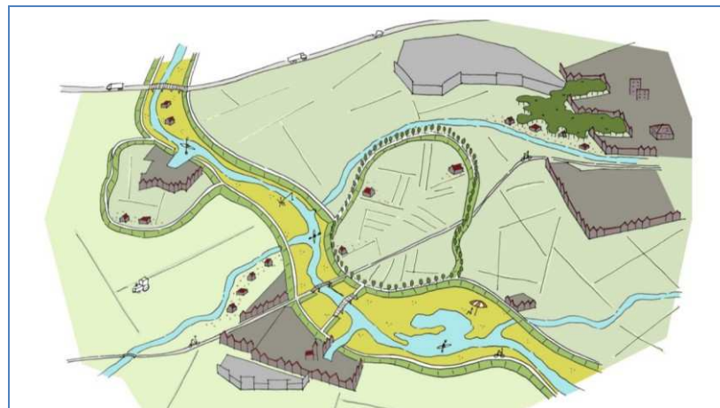
Figuur 2.3 Impressie van de relatie tussen bebouwd en onbebouwd gebied.

Figuur 2.3 laat toont de verhouding tussen de kernen en het omliggende groen. Om verrommeling van het buitengebied te voorkomen worden de identiteiten van platteland en bebouwing van dorpen en steden duidelijker geaccentueerd.