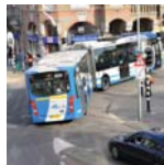
Thema Multimodale stedelijke bereikbaarheid