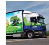
Thema Logistiek en internationaal