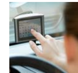
Thema Automotive en in-car