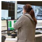
Thema Netwerkbreed verkeersmanagement

Een nadere uitwerking van de thema's is te lezen in het hoofddocument (beschikbaar op www.connekt.nl ).