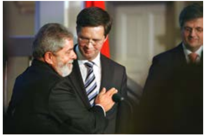
Staatsbezoek van de Braziliaanse president Luiz Inácio Lula da Silva aan Nederland op uitnodiging van koningin Beatrix in april 2008.

De inspanningen van Nederland voor Argentinië en Mexico zijn ver achtergebleven bij die voor Brazilië. Dat valt het meest op bij het economisch en politiek belangrijke Mexico. Mexico is voor Nederland in multilaterale aangelegenheden een waardevolle partner gebleken. Zo is er succesvol samengewerkt op terreinen