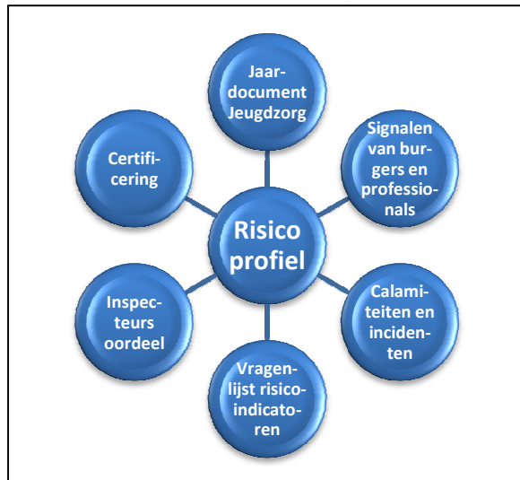
Figuur 2: risicomodel Inspectie Jeugdzorg

grootst zijn. Aan de hand van een zelf ontwikkeld risicomodel maakt de inspectie op een systematische wijze een inschatting van deze risico's. Een belangrijke bron voor dit risicomodel zijn de risico-indicatoren die de inspectie de afgelopen jaren voor een aantal werksoorten heeft ontwikkeld en waarop de instellingen tweejaarlijks worden bevraagd. Andere bronnen zijn bijvoorbeeld informatie die voortkomt uit signalen van burgers