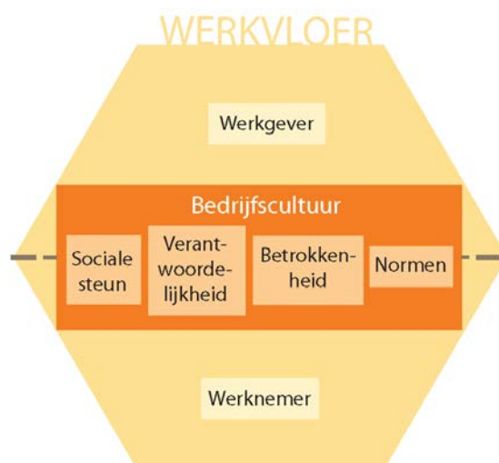
Figuur 2 De Werkvloer

De kern van de werkvloer wordt gevormd door de relatie tussen werkgever en werknemer. Samen vormen werkgever en werknemer de spil van de organisatie. Zij zijn dus ook de belangrijkste betrokken partijen wanneer het gaat om de preventie van beroepsziekten. Hoewel de werkgever en werknemer een relatie met elkaar hebben en dus verbonden zijn, is er ook een scheiding tussen de twee partners, onder andere op het gebied van de macht die de werkgever en werknemer hebben en de invloed die zij uit kunnen oefenen. Dat is grafisch weergegeven door de stippellijn in de figuur hierboven. Belangrijker nog is dat verschillende risicofactoren door hen in verschillende mate en op verschillende wijze zijn te beïnvloeden.