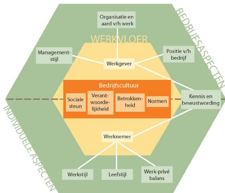
Figuur 3 Organisatie- en individueel niveau

De scheiding tussen werkgever en werknemer, weergegeven met een stippellijn, is ook op dit niveau aanwezig. De onderkant van de zeshoek, de werknemerskant, verbeeldt de individuele aspecten die van invloed zijn op het ontstaan van beroepsziekten en zijn werknemersspecifiek. In de bovenkant van de zeshoek, de werkgeverskant, staan de factoren die zich op organisatieniveau bevinden.