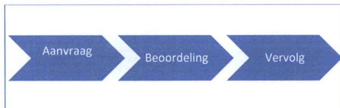
Figuur 1: stroomschema acute GGZ

Bij de vragenlijst hebben we onderstaande stroomschema gehanteerd. Er zijn vragen gesteld over de wachttijden tot een (eerste) beoordeling en de wachttijden bij het vervolg.