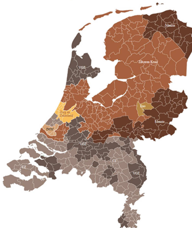
Figuur 1. Marktleider zorgverzekeraars per gemeente 2016

Bijna de helft van de verzekeraars maakt bij de inkoop van wijkverpleging onderscheid tussen het kernwerkgebied en de rest van Nederland. De overige vijf verzekeraars maken dit onderscheid niet. In onderstaand figuur is het kernwerkgebied per verzekeraar weergegeven.