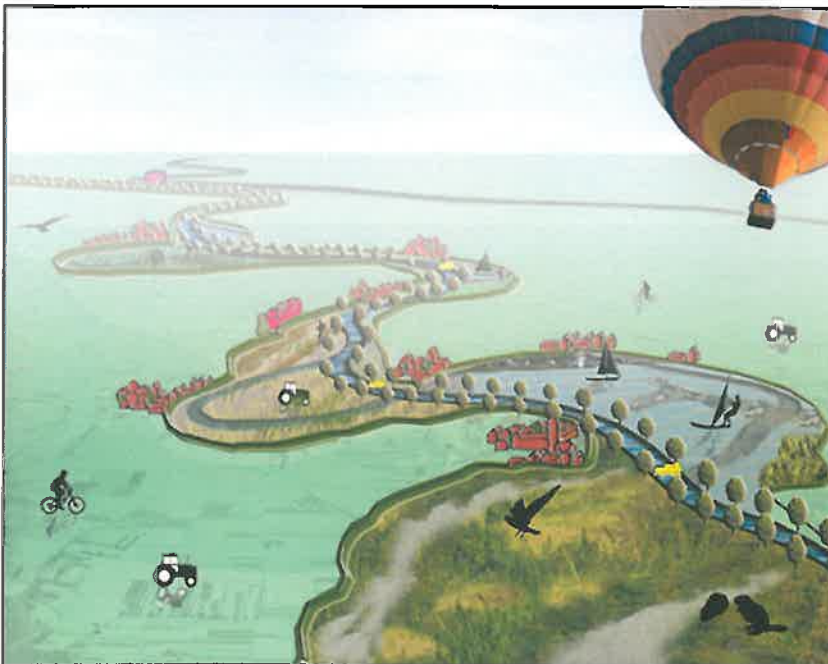
Figuur 1: het perspectief op de Meanderende Maas.

In het BO MIRT van 12 oktober 2016 is ingestemd met de start van een integrale verkenning voor Ravenstein-Lith. De start van de verkenning is onderdeel van een samenhangend pakket aan waterveiligheidsmaatregelen voor de gehele Maas. Dit pakket geeft invulling aan de urgente hoogwaterveiligheidsopgave en verbindt die met lokale ruimtelijke en economische ambities.