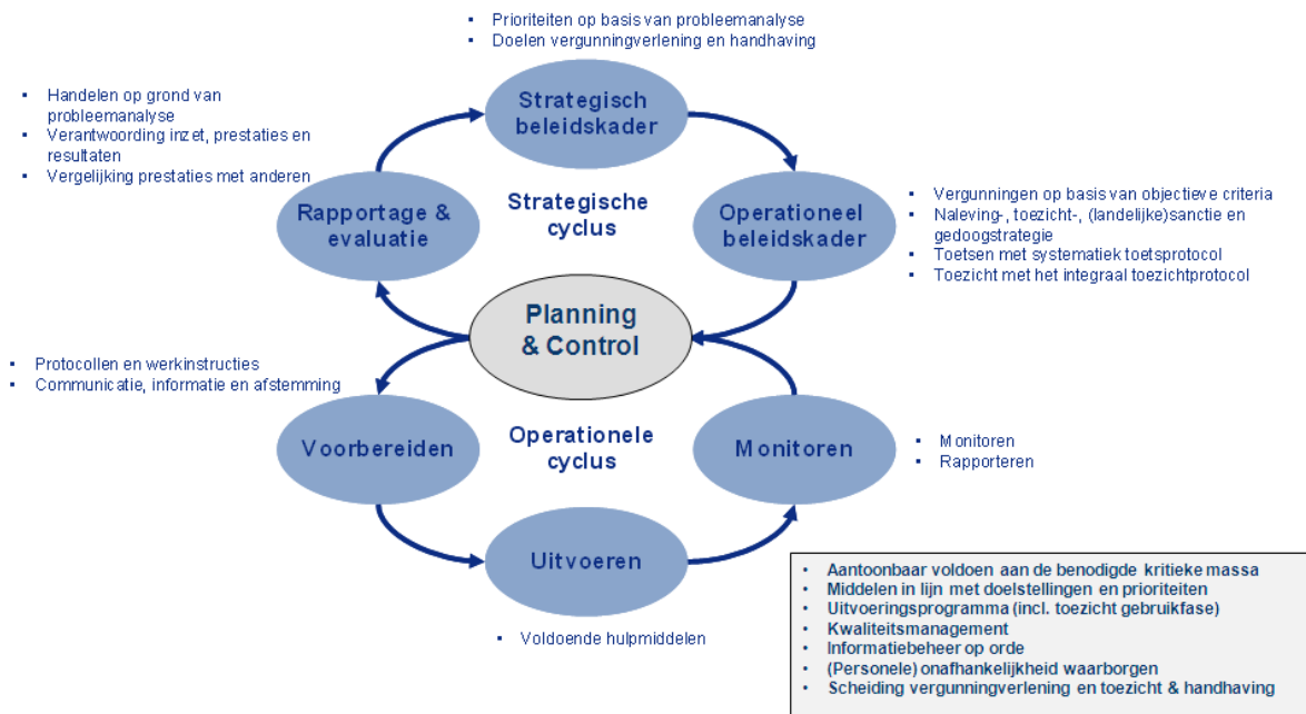
FIGUUR 1.1: BELEIDSCYCLUS MET PROCESCRITERIA OP HOOFDLIJNEN

Teneinde de kwaliteit van de uitvoering van VTH-taken op het gebied van het omgevingsrecht te verbeteren zijn kwaliteitscriteria – meer specifiek de set Kwaliteitscriteria 2.1 – vastgesteld. Naast procescriteria (big eight) worden ook eisen gesteld ten aanzien van deskundigheid en beschikbaarheid (vereiste opleidings-, kennis- en ervaringsniveau en de minimaal vereiste beschikbaarheid van ervaren deskundigen). 9