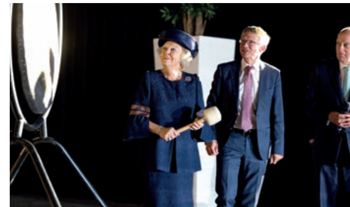
KH Prinses Beatrix opent met een gongslag het opslaggebouw voor verarmd uranium (VOG-2) op 13 september 2017.

Volgens de Adviesgroep is het belangrijk om in gesprek te gaan over de onzekerheden die er zijn over een eindberging. Die geven ruimte voor een dialoog over de oplossingen. Dit geldt vooral voor de zogenaamde 'safety-case', het model waarmee wordt aangegevoerd wat de risico's zijn voor een oplossing van een eindberging en waarmee onzekerheden worden geïdentificeerd.