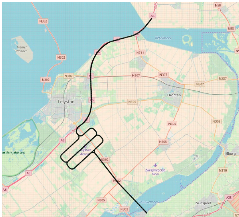
Figuur 1: Start en landingsroutes helikopter- en klein verkeer

Zouden de gemodelleerde routes van het helikopter en kleine verkeer doorgetrokken worden tot de randen van het rekengebied, dan zou dit zeer beperkt van invloed zijn op de rekenresultaten. Er zal geen effect optreden op de geluidbelasting in handhavingpunten en bij het 45k scenario zal alleen de 40 dB(A) Lden contour mogelijk iets wijzigen. Een argument om de routes bij Harderwijk en de Ketelbrug niet verder door te tekenen kan zijn geweest dat het verkeer zich vanaf die punten in de praktijk zal verspreiden naar allerlei min of meer willekeurige richtingen. De geluidbelasting zal dan verspreid worden over de omgeving en niet meer zichtbaar worden in een 40 dB(A) Lden contour. Daarmee is de in het MER gemaakte keuze om de routes niet verder door te trekken verklaarbaar en acceptabel.