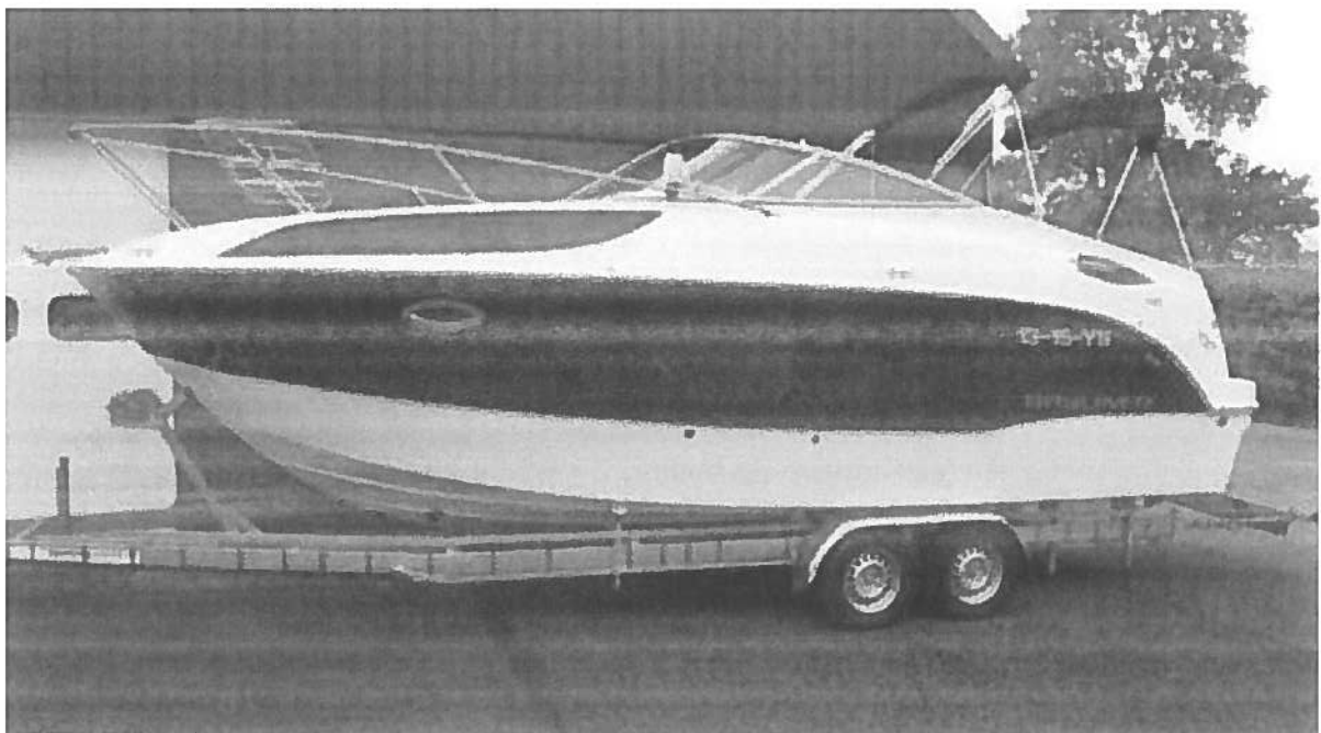
Deze Bayliner 225 - Mercruiser 5.0 V8 MPI 260 pk met duoprop (2013) kost € 95.950,= Max. snelheid 49 knopen (90 km/u)

Voor het nemen van maatregelen is het in dit kader ook niet relevant om exact te weten om hoeveel gevallen het gaat. Veel urgenter is het feit dat de Intelligence afdelingen van de Nederlandse Politie signalen afgeven dat criminelen en criminele organisaties (CSV) steeds vaker worden gelinkt aan het bezit van dure pleziervaartuigen. De constatering dat de overheid mede debet is aan deze vorm van frauderen en witwassen (wettelijke basis), maakt het argument om sec op basis van aantallen maatregelen te nemen, ondergeschikt. Het bovengenoemde feit, moet reden genoeg zijn om snel adequate maatregelen te nemen.