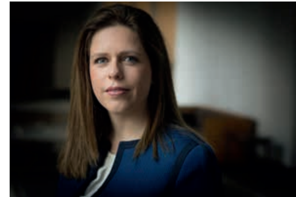
Carola Schouten minister van Landbouw, Natuur en Voedselkwaliteit

'Vertrouwen in de toekomst' is het motto van dit kabinet. Ik heb er veel vertrouwen in dat we toe kunnen werken naar kringlooplandbouw, en dat we daar samen met boeren, tuinders en vissers, andere ondernemers en maatschappelijke partijen onze weg in vinden.