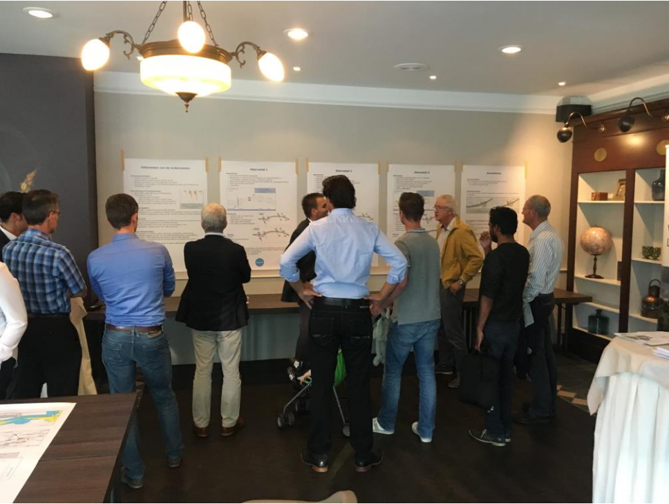
Afbeelding: tijdens de inloopbijeenkomsten konden aanwezigen hun advies aan de wethouder meegeven.