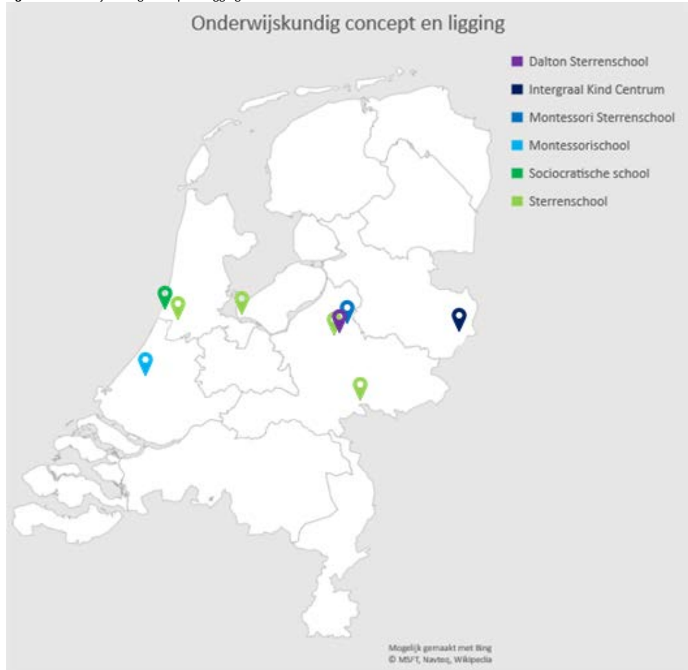
Figuur 2. Onderwijskundig concept en ligging