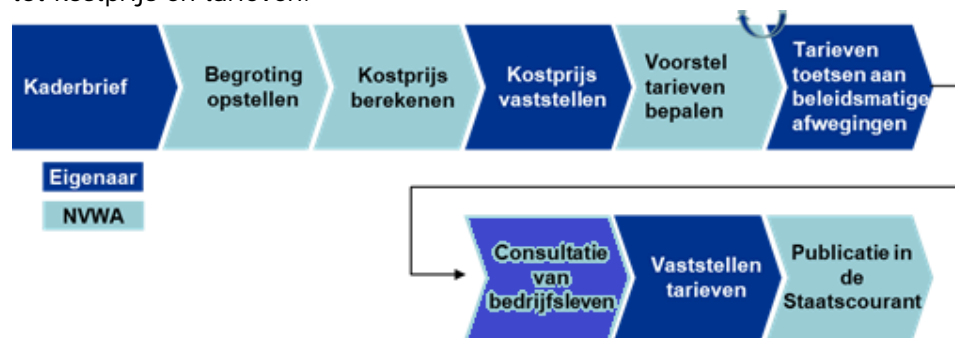
Figuur 1 – Proces van begroting tot tarieven (bron: NVWA)

De jaarlijkse begroting is uitgangspunt voor de voorcalculatie van de kostprijs en de daaruit volgende tariefbepaling. De NVWA doet zowel voor de kostprijs als voor de tariefstelling een voorstel, de eigenaar stelt deze vast. Onderstaand zijn de in opzet geldende hoofdstappen van het proces opgenomen om jaarlijks te komen tot kostprijs en tarieven.