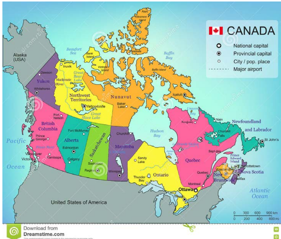
Kaart 1: Canada en zijn provincies en territoriale gebieden

ongeveer 2300 gebieden waarin inheemse volkeren (indianen en Eskimo's) verblijven, hebben een bepaalde mate van zelfbestuur.