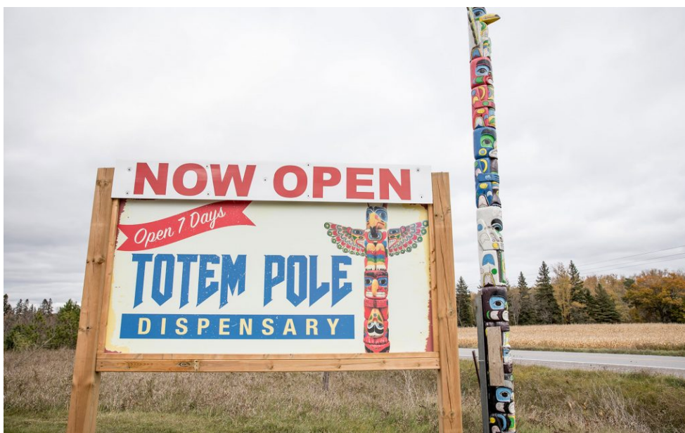
Reclame voor een cannabis-dispensary in een first-nations territory nabij Alderville, Ontario

De cannabisregulering in reservaten is in principe gelijk aan die in de rest van Canada, maar de handhaving is afwijkend. Er is een ongoing debate over zelfbestuur en juridische verantwoordelijkheden tussen federale overheid, provincie en first nations-leiders; die laatsten betwisten de bevoegdheid van federale en provinciale overheden om handhavend op te treden op hun grondgebied. Bij de politie bestaat bovendien grote terughoudendheid op dit punt, mede vanwege incidenten in het verleden. Berucht zijn de onlusten in Oka, een gemeente in Quebec, in 1990; de lokale Mohawk verzetten zich toen heftig tegen plannen om een golfterrein aan te leggen in een gebied waar zij aanspraak op maakten. De onlusten hielden maandenlang aan en werden pas na tussenkomst van het Canadese leger beëindigd. Zij kostten enkele levens, waaronder dat van een Canadese politieagent. 14