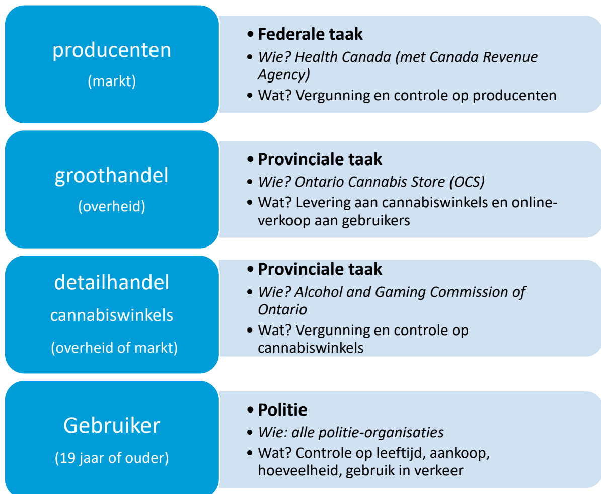
Figuur 1: Het gelegaliseerd systeem voor recreatief cannabisgebruik: wie is waarvoor verantwoordelijk?

18. Het is verboden om buiten het hier geschetste systeem om cannabis te distribueren, te produceren of te verkopen. Men mag geen equipment bezitten met als intentie om die te gebruiken voor de illegale productie of distributie. Bezit van meer dan dertig gram – in de openbare ruimte – is strafbaar. Ook is het verboden om cannabis te importeren of te exporteren (behalve voor medicinaal gebruik). Binnen Canada heeft iedereen – Canadees staatsburger of niet – dezelfde rechten, ook toeristen. De straffen variëren van een boete tot maximaal 14 jaar gevangenisstraf (in de praktijk wordt die hoge straf nooit opgelegd).