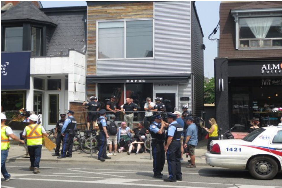
De politie sluit één van de dispensaries van de CAFE-keten in Toronto, juli 2019.

In juli 2019 bracht CBC News het verhaal over een in Toronto gevestigde dispensary-keten met de naam CAFE (Cannabis And Fine Edibles). Vestigingen daarvan zijn sinds oktober 2018 tenminste een dozijn keer gesloten, om iedere keer weer heropend te worden, meestal binnen een paar uur. Volgens de CAFE-keten zelf doen zij dit, omdat hun klanten recht hebben op een ‘ reasonable, dignified acces ’ tot cannabisproducten, terwijl de overheid faalt om daarin te voorzien. Volgens anderen is de dagelijkse opbrengst van C$30.000 tot C$50.000 per winkel een zeker zo belangrijk motief. Achter de illegale cannabisketen blijken eigenaren te zitten met een verdacht verleden; zij hebben een strafblad voor illegaal kweken van cannabis en voor fraude en namaak (counterfeiting). Voorlopig is het de overheid nog niet gelukt om de cannabisketen definitief gesloten te krijgen. 16