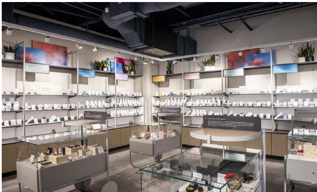
Het interieur van Tokyo Smoke in Toronto

in modern en zakelijk uitziende displays, waarbij men de cannabis kan zien en ruiken. Verkrijgbaar zijn kleine boekjes, waarin men aantekeningen kan maken over het effect van de gekochte soort(en). Verkocht wordt de cannabis in porties van 3-5 gram, in verpakkingen die aan strenge voorschriften moeten voldoen en waarop in ieder geval duidelijk het THC-gehalte vermeld moet zijn. De prijs varieert van dertig tot vijftig Canadese dollars per drie gram. Bij binnenkomst van de winkel moet een