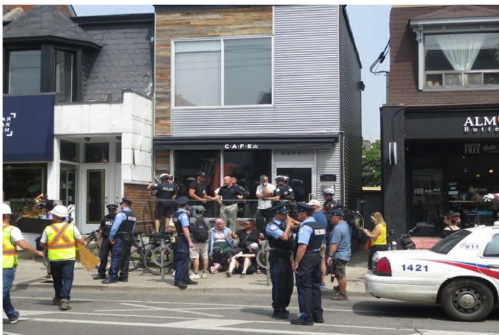
De politie sluit één van de dispensaries van de CAFE-keten in Toronto, juli 2019.

In juli 2019 bracht CBC News het verhaal over een in Toronto gevestigde dispensary-keten met de naam CAFE (Cannabis And Fine Edibles). Vestigingen daarvan zijn sinds oktober 2018 tenminste een dozijn keer gesloten, om iedere keer weer heropend te worden, meestal binnen een paar uur. Volgens de CAFE-keten zelf doen zij dit, omdat hun klanten recht hebben op een ‘ reasonable, dignified acces ’ tot cannabisproducten, terwijl de overheid faalt om daarin te voorzien. Volgens anderen is de dagelijkse opbrengst van C$30.000 tot C$50.000 per winkel een zeker zo belangrijk motief. Achter de illegale cannabisketen blijken eigenaren te zitten met een verdacht verleden; zij hebben een strafblad voor illegaal kweken van cannabis en voor fraude en namaak (counterfeiting). Voorlopig is het de overheid nog niet gelukt om de cannabisketen definitief gesloten te krijgen. 16