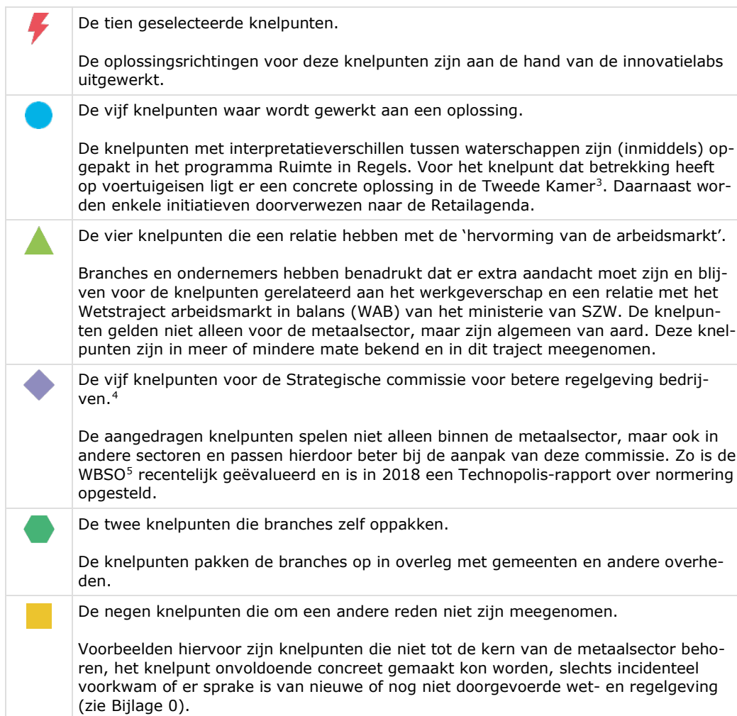
Tabel 1. Legenda bij de knelpunten