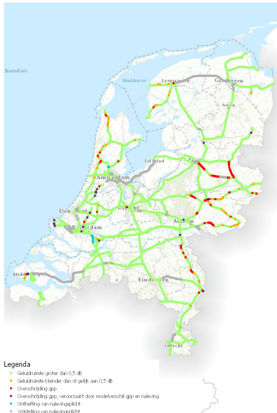
Figuur 2: Landelijk beeld van de gpp-naleving in 2018