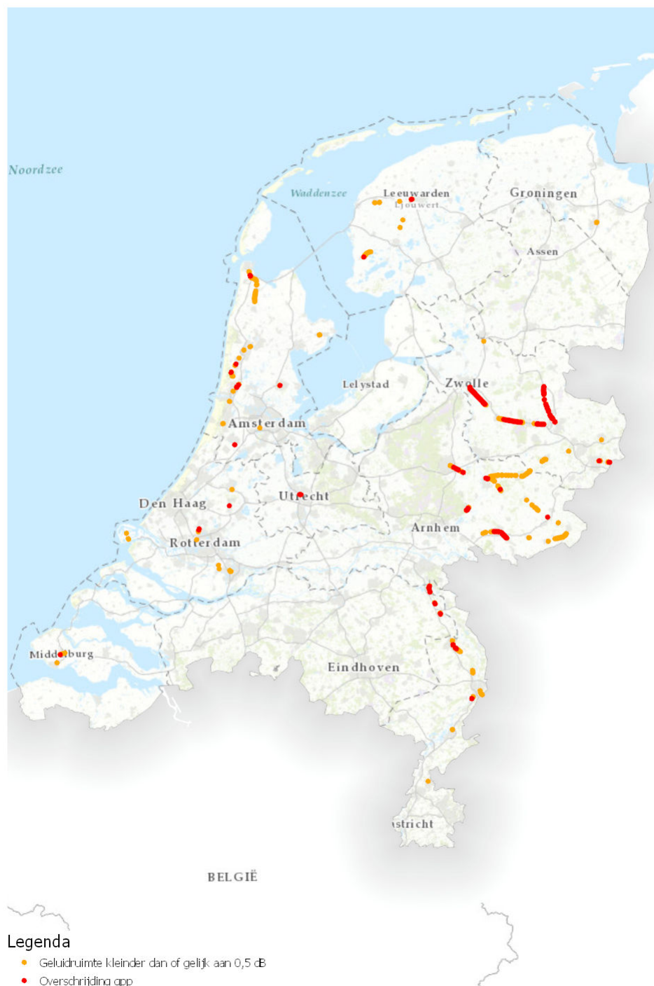
Figuur 1: Landelijk beeld van gpp-overschrijdingen en baanvakken met een krappe geluidruimte

In de volgende paragrafen worden de twee categorieën gpp-overschrijdingen nader uitgewerkt.