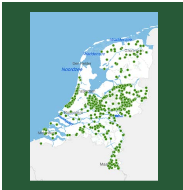
Kaart 1. Overzichtskartaal rijksbeschermd buitenplaatsen 11

kent zo'n 1400 groene rijksmonumenten die zijn opgenomen in het monumentenregister 10 .