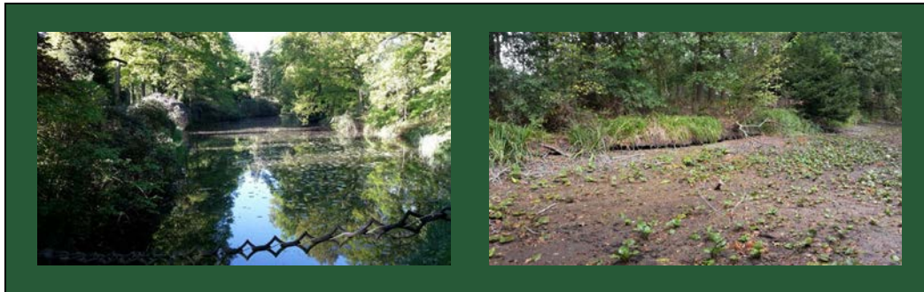
Afbeelding 3. Vijver en drooggevallen vijver op een landgoed 29

Uit onderzoek van Stichting Kastelen, Buitenplaatsen & Landgoederen (SKBL, september 2019) onder kasteel- en landgoedeigenaren geeft 78% van de respondenten aan blijvende schade te verwachten als gevolg van de droogte. Het SKBL-onderzoek 30 kreeg media aandacht van het NOS-journaal, de Telegraaf en EenVandaag 31 .