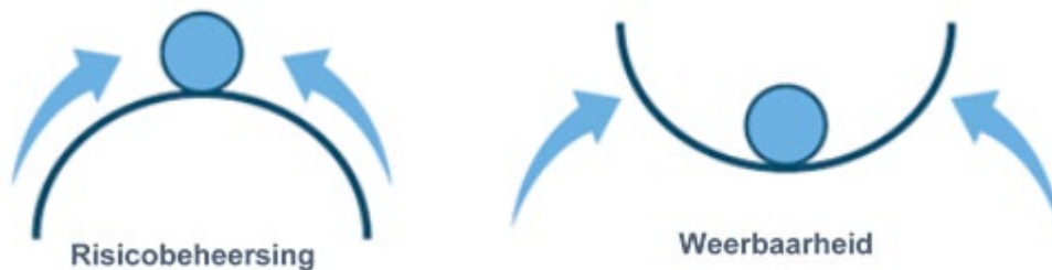
Figuur 6.1 Verschil tussen risicogedreven inrichting van plantgezondheid en een op weerbaarheid gefundeerde aanpak. (Uit: Erisman et al., 2016. AIMS Agriculture and Food Volume 1, Issue 2, 157-174)

Daaronder worden in het UP de componenten besproken die een bijdrage leveren aan de weerbaarheid. Daarin is een opbouw in schaalniveaus te herkennen: