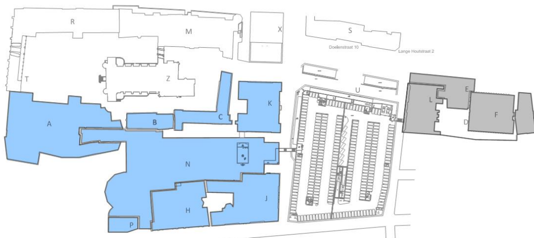
Fig. 1 – gebouwen Tweede kamer binnen scope (grijs is in scope, maar onderzoek is nog in bewerking)

Het onderzoek betreft de gebouwen Binnenhof 1a-7 (bouwdelen A, B en C), Koloniën (K), Justitie (J), Nieuwbouw (N), Perstoren (P), Logement (L), Lange Houtstraat(E), Depot (F) en Bleyenburg 7 (G). Het onderzoek voor de bouwdelen L, E, F en G is nog in bewerking en wordt later aan deze rapportage toegevoegd. Buiten de scope vallen de gebouwen aan de Doelenstraat, omdat dit een “huurobject betreft.