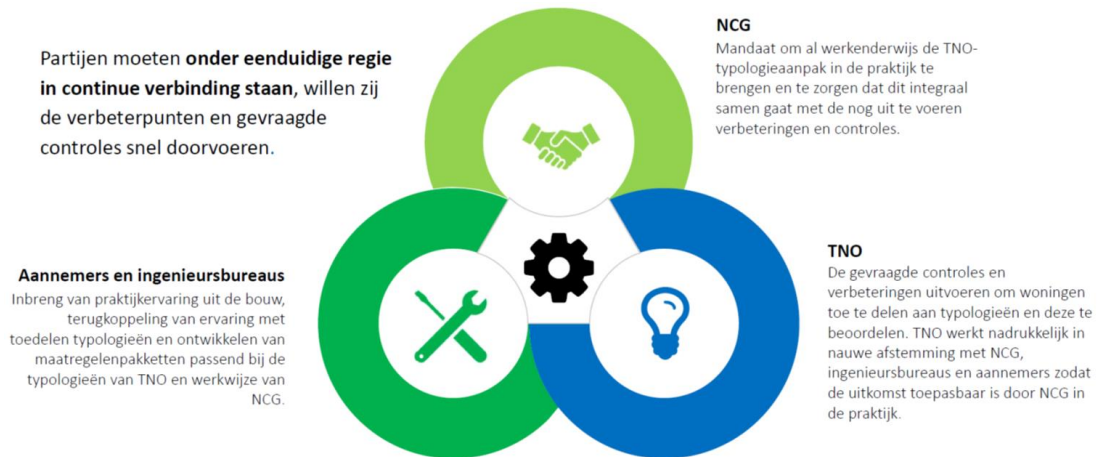
Figuur 1: Partijen moeten via een (project)sturing in continue verbinding staan, willen de verbeterpunten en gevraagde controles snel worden doorgevoerd.

Wij adviseren u om binnen de NCG een aparte sturing op de typologieaanpak in te stellen met aan de leiding een ervaren en gezaghebbende projectdirecteur komende uit de bouwsector. Hij of zij is lid van het MT en moet het mandaat hebben om al werkenderwijs de TNO-typologieaanpak in de praktijk te brengen en te zorgen dat dit integraal samen gaat met de nog uit te voeren verbeterpunten en controles. De projectdirecteur zorgt voor een gezamenlijke inzet en betrokkenheid van TNO, NCG, ingenieursbureaus en aannemers om de theorie met de praktijk te verbinden (zie figuur 1). Hierdoor ontstaat focus en naar de overtuiging van het ACVG ook voortgang en tempo.