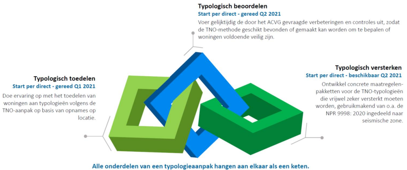
Figuur 2: De drie trajecten binnen de integrale aanpak.

met een beperkte versterkingsmaatregel alsnog binnen een typologie valt. Zo vormen typologisch toedelen, beoordelen en versterken één integrale keten (zie ook figuur 2).