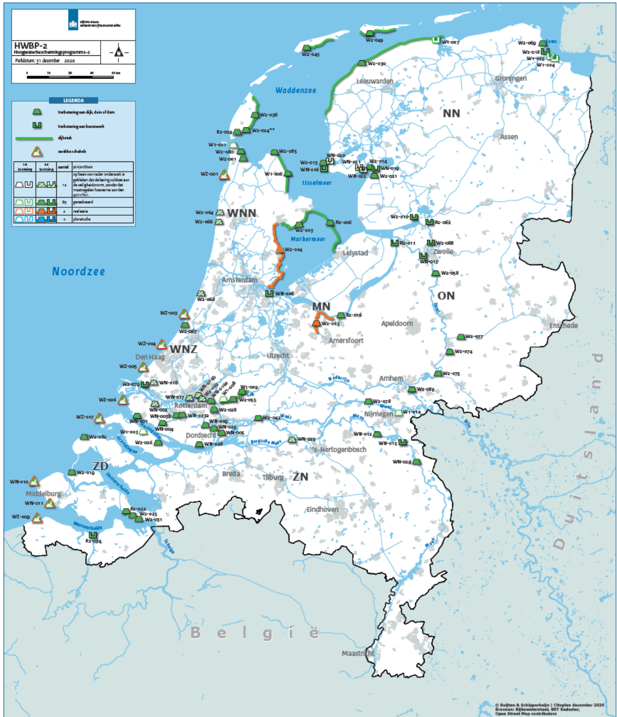
Figuur 2 Actuele scope van het programma, peildatum 31 december 2020