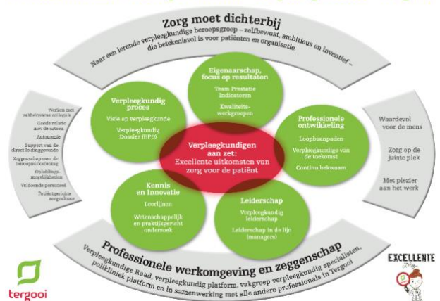
Professioneel Praktijk Model Verpleegkunde Tergooi

In Tergooi startten in 2016 de verpleegkundigen met een traject voor het verbeteren van de werkomgeving en professionele zeggenschap. Ter ondersteuning ontwikkelden zij het professionele praktijkmodel (figuur). Een nulmeting op basis van de pijlers Excellente zorg hielp de verpleegkundigen om te bepalen wat er nodig was om een sterke verpleegkundige organisatie neer te zetten. Een herhaalde meting in 2019 liet zien dat verbeteringen op alle Excellente zorg-pijlers zichtbaar was. Ook de komende jaren werkt Tergooi aan het versterken van de verpleegkundige organisatie en professionele zeggenschap, met elke drie jaar metingen zodat er inzicht is in de ontwikkelingen en waar nodig