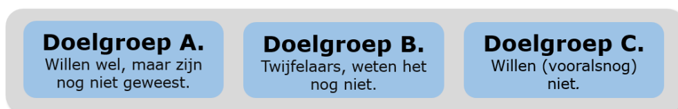
Figuur 1. Er zijn drie groepen te onderscheiden van mensen die nog niet gevaccineerd zijn.

De interventies die de GGD'en de afgelopen maanden hebben ingezet, zijn vooral gericht op doelgroep A: mensen die zich willen laten vaccineren, maar dat om wat voor reden dan ook nog niet hebben gedaan. Zij ervaren vaak fysieke barrières, die weggenomen kunnen worden door interventies als prikkenzonderafpraak.nl, de prikbus, de vrije inloop, pop-up locaties, etc. Daarmee zorgen de GGD'en ervoor dat het daadwerkelijk laten zetten van de prik zo makkelijk mogelijk wordt gemaakt. Maar ook wordt op doelgroep B ingezet met duidelijke informatie op meerdere manieren en met meerdere kanalen.