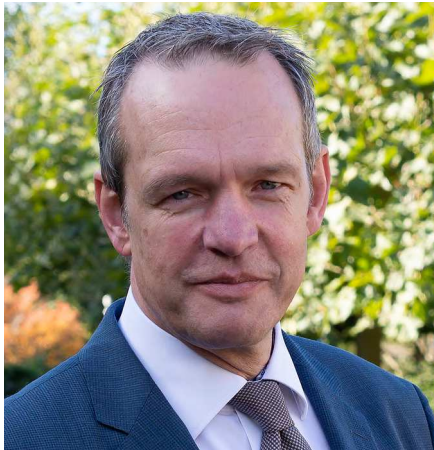
De Inspecteur-Generaal Veiligheid, Wim Bargerbos

De inspectie bedankt alle betrokkenen voor hun medewerking en hoopt met dit rapport handvatten te bieden om de benodigde verbeteringen vorm te geven.