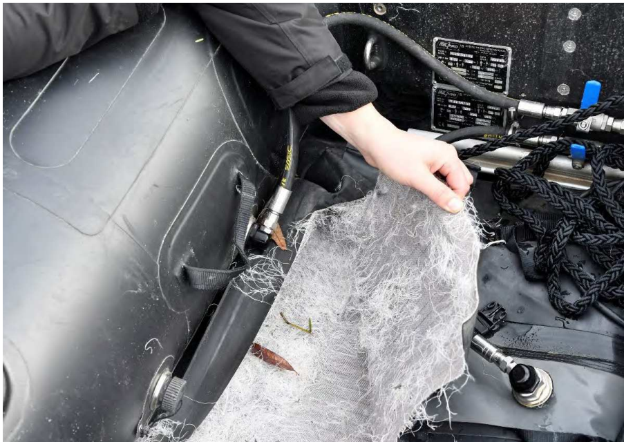
Figuur 6 Plaats waar de bodem is uitgescheurd