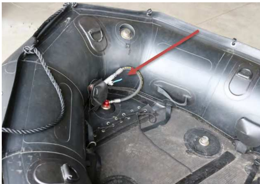
Figuur 3 Afsluiter in de boeg van een onbeschadigde Zodiac