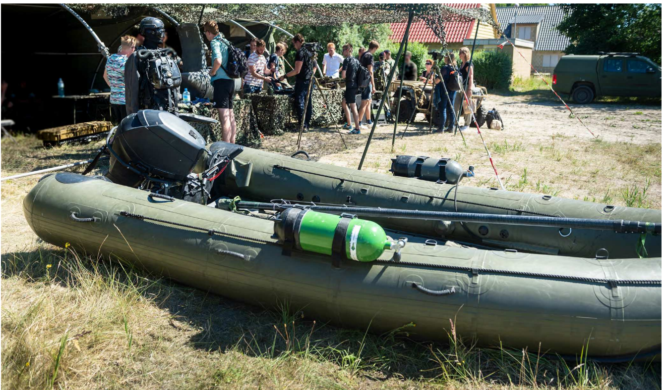
Figuur 7 DeBatts Rubber Rigid Inflatable Boat 5.20m zoals te zien bij de Infodag Korps Mariniers

De DMI heeft lessen uit onderzoek naar een eerder incident met een RRIB van MARSOF niet gedeeld met de leverancier, de fabrikant en gebruikers van vergelijkbare boten bij Defensie, waaronder het KCT.