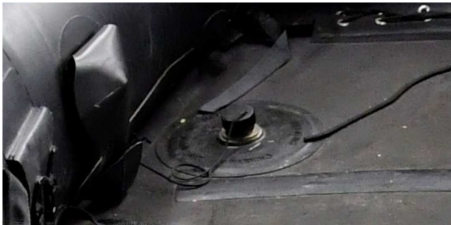
Figuur 4 Overdrukventiel met beschermdop bij een onbeschadigde Zodiac

Om te voorkomen dat tijdens het vullen de druk in een compartiment te hoog oploopt, zijn op verschillende plaatsen in de huid van de Zodiac overdrukventielen aangebracht. Deze beginnen af te blazen zodra de maximaal toegestane vuldruk is bereikt. De overdrukventielen zijn voorzien van kunststof beschermdoppen die vóór het vullen van de boot moeten worden verwijderd (figuur 4). Gebeurt dit niet, dan kan het ventiel zijn werk niet doen en loopt de spanning in het compartiment te hoog op. Het moment dat de overdrukventielen beginnen af te blazen, is voor de gebruiker het signaal dat het compartiment de juiste spanning heeft bereikt. De luchttoevoer vanuit de persluchtfles moet dan worden gestopt en alle nog openstaande afsluiters moeten met behulp van de hendels worden gesloten. Ten slotte worden de kunststof beschermdoppen weer aangebracht om luchtverlies tijdens het varen te voorkomen en de ventielen te beschermen tegen vuil.