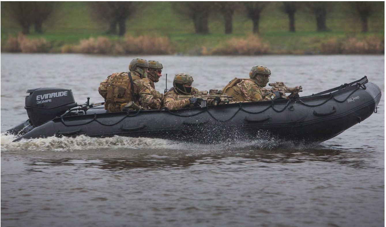
Figuur 1 De Zodiac Milpro FC 470 Evol 7

De hogedrukbodem is zodanig geconstrueerd dat deze - eenmaal op de juiste druk - een stijf werkplatform creëert en tevens vorm- en lengtestijfheid aan de boot geeft. Onder de hogedrukbodem bevindt zich de kiel van de boot die eveneens afzonderlijk is op te blazen.