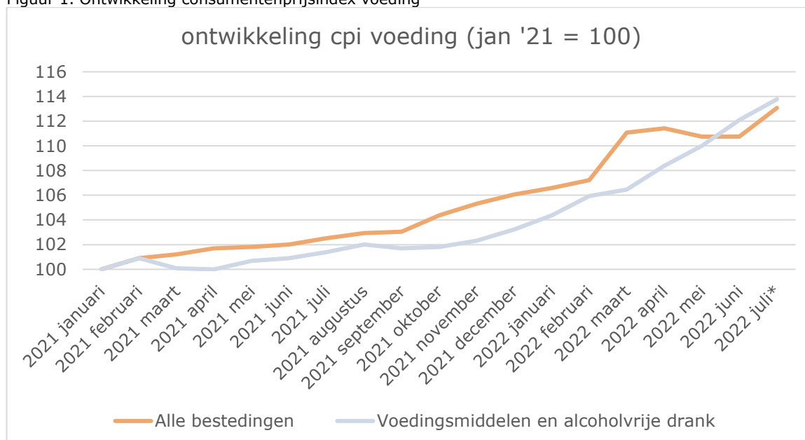
Figuur 1. Ontwikkeling consumentenprijsindex voeding

Toch ervaren ook uitwonende studenten de gevolgen van de hoge inflatie en worden zij net als andere huishoudens het hardst geraakt door de prijsstijgingen van energie en voeding. Onderstaande grafieken laten zien hoe de inflatie zich sinds januari 2021 heeft ontwikkeld: