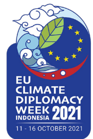
EU Climate Diplomacy

Ten slotte zijn we ervan overtuigd dat onze nationale inzet op mondiaal klimaatbeleid sterker en effectiever is als we eensgezind als EU opereren. Waar mogelijk zoekt Nederland daarom deze samenwerking op en stimuleren we een actieve externe EU-inzet op klimaat op de drie pijlers van het Parijsakkoord. Dit doen we zowel op diplomatiek vlak als via Team Europe initiatieven en het externe financieringsinstrumentarium van de EU, het Neighborhood, Development and International Cooperation Instrument (NDICI). Waar EU-breed optreden niet haalbaar is, zoeken we actief de samenwerking op met gelijkgezinde EU-partners.