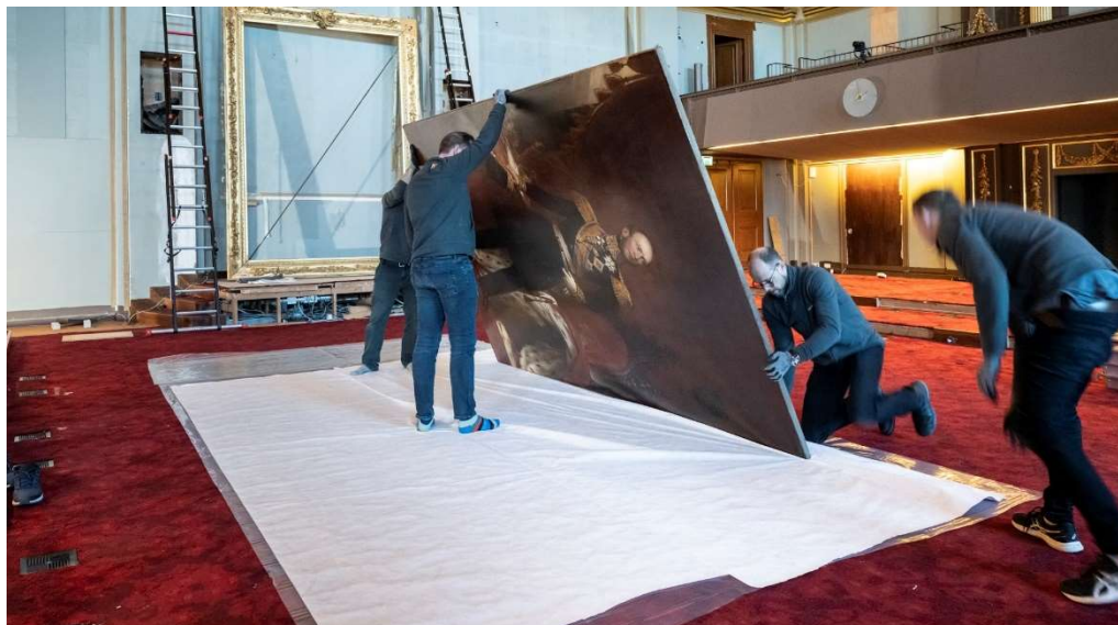
Ontmanteling plenaire zaal, Tineke Dijkstra

In de periode van februari tot en met juli 2022 heeft de onderzoeksfase voor het Eerste Kamer complex zich vooral gericht op technische demontages en destructieve ingrepen ten behoeve van specifieke onderzoeken, zoals funderingsinspecties en asbestonderzoeken. Daarnaast is de plenaire zaal ontmanteld ter voorbereiding op de bouwwerkzaamheden.