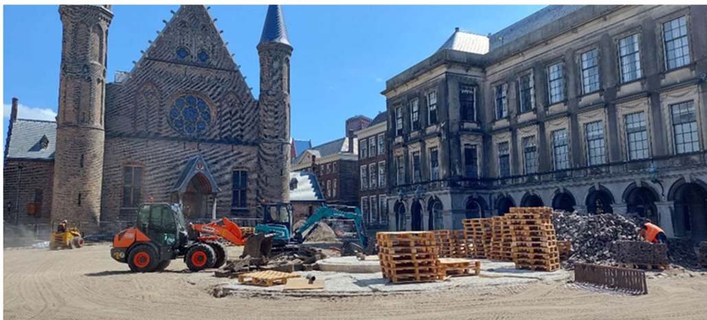
Ontmanteling Binnenhoffontein, Michiel Hartkamp

Ook is in deze periode de Binnenhoffontein op het Opperhof ontmanteld en is de stenen bestrating verwijderd en naar de opslag gebracht. Naast de uitpandige werkzaamheden worden de gebouwen inpandig bouwgereed gemaakt: her te gebruiken onderdelen zoals stalen plafondplaten zijn ontmanteld en opgeslagen; kwetsbare delen van de complexen worden uitgenomen en ingetimmerd ter bescherming. Ook hebben er in verschillende complexdelen inpandige asbest onderzoeken en saneringen plaatsgevonden.