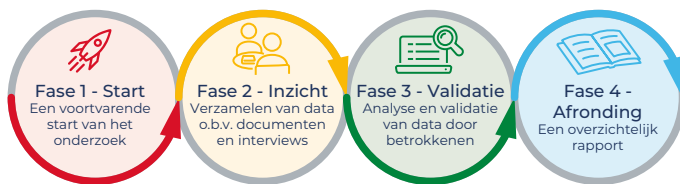
Figuur 2. Schematische weergave onderzoeksopzet.

Het onderzoek bestaat uit vier fasen, zoals schematisch weergegeven in figuur 2.