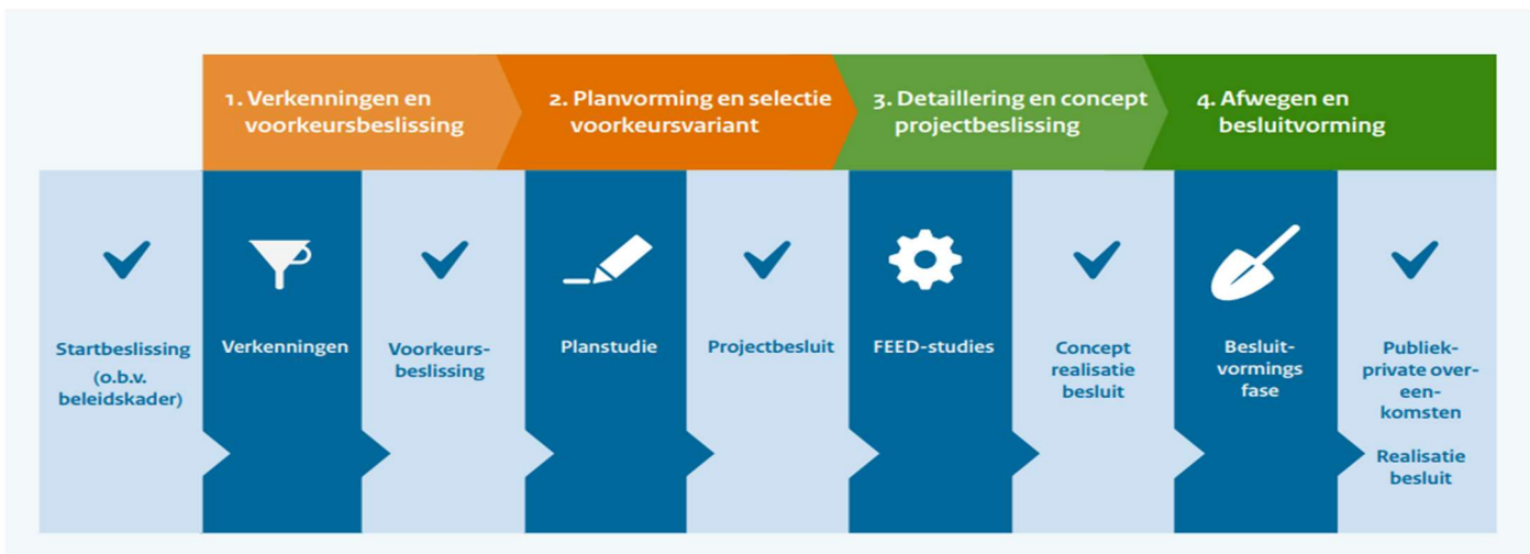
Figuur 1. Fasen van een MIEK-proces voor grondstoffen- en energie-infrastructuur-

De behoefte aan nieuwe energie- en grondstoffeninfrastructuur wordt (mede) ingegeven voor het behalen van de klimaatdoelen in 2030 door de industrie. De infrastructuur moet tijdig gereed zijn om die klimaatdoelen te behalen. Zowel binnen het bedrijfsleven als de overheid bestaan er zorgen of dit zonder extra maatregelen gaat lukken (zie verder paragraaf 2.1).