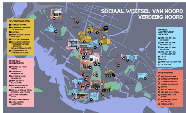
Figuur 2: Voorbeeld van een 'sociale infrastructuur', bestaande uit zowel informele als formele plekken, in dit geval van Amsterdam Noord.

Een architect die het altijd heeft over het belang van contact en interactie, is Herman Hertzberger. Sinds het begin van zijn loopbaan probeert hij ruimtelijke condities te scheppen voor de basale behoefte aan contact. Zijn bekendste ontwerp vondst is de tribunetrap, waarop je kunt zitten, werken en kletsen. Ook iemand als Jan Gehl heeft van uit die invalshoek pleidooien gehouden voor 'levendige plinten' bij hoogbouw en het idee om steden vooral 'op ooghoogte' te ontwerpen.