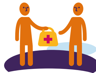
6 Begeleiding en hulp