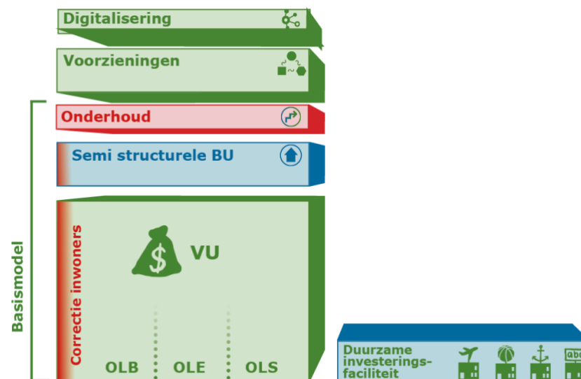
Figuur B. Verrekening belastingcapaciteit