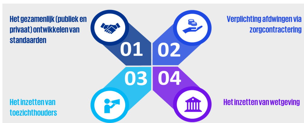
Figuur: Vier instrumenten om te komen tot verplichting

De instrumenten worden in de aangegeven volgorde getoetst aan de hand van een aantal onderdelen die elk even zwaar wegen.