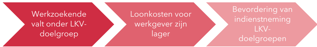
Figuur 2.1. Werkingsproces van het instrument LKV

De werkgever wordt aangemoedigd om de werkzoekende uit de LKV-doelgroep aan te nemen. Van der Werff et al identificeren enkele randvoorwaarden voor een goede werking van het LKV bij het aannemen van werkzoekenden uit de LKV-doelgroep: