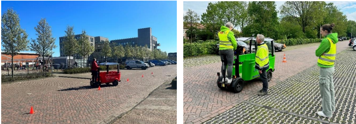
Figuur 5. Praktijktraining BSO bus VVCR-Prodrive en Stichting Veilig door het Verkeer

Beide aanbieders hebben veel aandacht voor de kwaliteitsbewaking van de trainingen. Zo worden de trainingen enkel verzorgd door WRM gecertificeerde trainers, die tevens beoordelen of de deelnemers voldoende competent zijn. Bij beide aanbieders ontvangen de trainers een lesplan, waarin onder andere het doel, de inhoud, de vorm en de wijze van beoordeling van de training is uitgewerkt. De trainers worden intern opgeleid en volgen reguliere bijscholingen. De trainingen worden cyclisch (bijvoorbeeld jaarlijks) geëvalueerd en beide aanbieders worden extern getoetst of zij de certificaten terecht afgeven. De verzekeraar houdt toezicht op de rijtrainingen en beoordeelt de kwaliteit van de training steekproefsgewijs. De verzekeraar ziet 90-95% minder schade en ongevallen bij bestuurders die een BSO bus training gevolgd hebben.