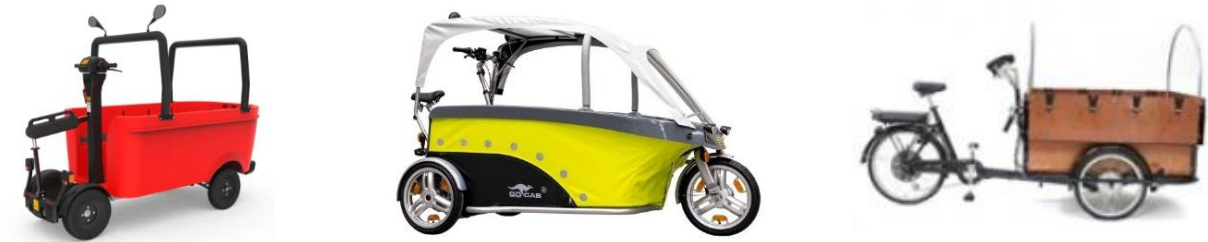
Figuur 4. Voorbeelden LEV categorie 2b personenvervoer: BSO bus en elektrische bakfiets voor personenvervoer (Stint Urban Mobility, 2023a; GoCab, 2023; Rijkswaterstaat WVL, 2022)

Na het ongeval met de Stint in Oss in 2018 zijn er verschillende aanpassingen aan het voertuig gedaan. De BSO bus heeft grotere banden, meer veiligheidsknoppen en rolbeugels. Daarnaast is er naar aanleiding van het Stint ongeval een convenant 3 opgesteld tussen de minister van IenW en de Sectororganisaties Kinderopvang (Ministerie van Infrastructuur en Waterstaat, 2019). In dit convenant zijn afspraken gemaakt tussen het ministerie en de sectororganisaties over het veilig gebruik van de BSO bus op de openbare weg die gelden voor alle bestuurders van de BSO bus. Eén van deze afspraken is dat de bestuurder aantoonbaar en met goed gevolg een rijvaardigheidstraining gericht op het besturen van de BSO bus moet hebben afgerond en over een certificaat moet beschikken. Daarnaast mag de BSO bus alleen bestuurd worden door een medewerker van 18 jaar of ouder en dient de BSO bus als bijzondere bromfiets minimaal voor Wettelijke Aansprakelijkheid (WA) verzekerd te zijn. Sinds het convenant van toepassing is, zien de aanbieders van de BSO bus trainingen dat het aantal BSO bussen op de weg weer toeneemt.