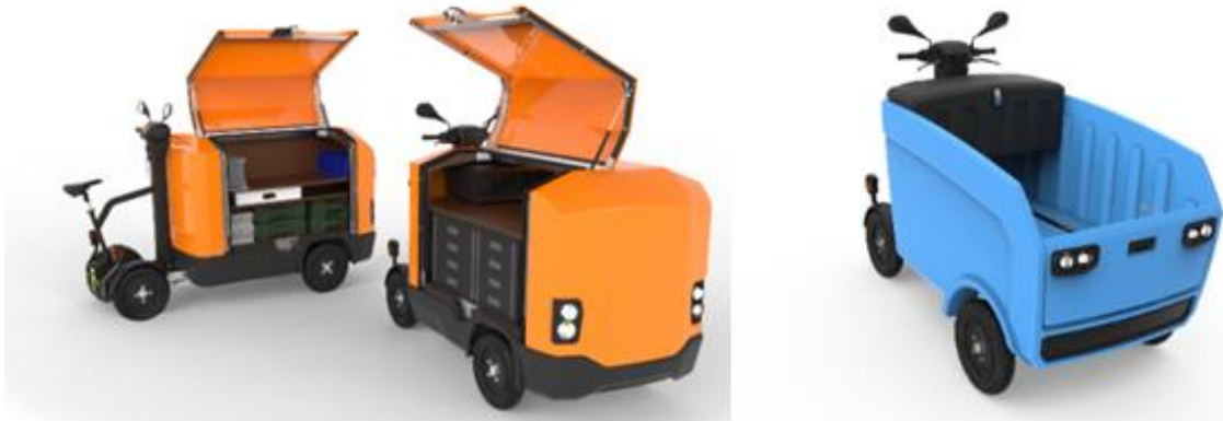
Figuur 3. Stint Cargo en Stint Pickup (Stint Urban Mobility, 2023b; 2023c)

Naast de verschillen in specifieke voertuigkenmerken, zijn er binnen LEV categorie 2a ook grote verschillen in het aantal rijuren van de bestuurders. Voor een pakketbezorger is het vervoeren van goederen de kerntaak. Een pakketbezorger rijdt dagelijks dan ook veel meer uren met het voertuig dan bijvoorbeeld een glazenwasser of hovenier die het voertuig alleen gebruikt van en naar de locatie tewerkstelling in de binnenstad.