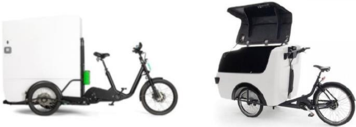
Figuur 2. Voorbeelden e-cargobike (Rijkswaterstaat WVL, 2022)

In april 2023 zijn er twee nieuwe categorie 2a LEV's toegelaten tot de openbare weg: de Stint Cargo en de Stint Pickup (zie Figuur 3). Ook deze LEV's worden breed ingezet: door de facilitaire dienstverlening, gemeenten, de recreatiesector, transport & logistiek en schoonmaakservices (Stichting Veilig door het Verkeer, 2023). De Stint Cargo wordt gebruikt voor pakketbezorging (Last Mile Delivery), maar ook voor bijvoorbeeld service- of onderhoudswerk in de binnenstad (Stint Urban Mobility, 2023b). Ook de Stint Pickup kent vele toepassingen, bijvoorbeeld afvalinzameling, groenvoorziening en onderhoud in de binnenstad (Stint Urban Mobility, 2023c). Naast op de openbare weg is het ook toegestaan om met de Stint Pickup te rijden op eigen terrein, bijvoorbeeld voor groenvoorziening en huishouding op vakantieparken en voor werkzaamheden op het gebied van schoonmaak, service en onderhoud op eigen terrein (Stint Urban Mobility, 2023d).