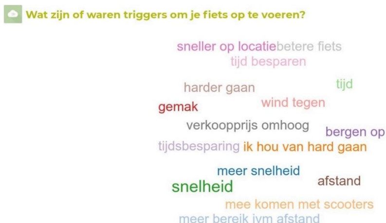
Figuur 1: Triggers woordenwolk groep 1 'van plan om fiets op te voeren'

De deelnemers aan de groepsdiscussies hebben via een online tool hun spontane antwoord gegeven op de vraag: Wat zijn of waren triggers om je fiets op te voeren? De deelnemers aan de individuele gesprekken hebben hier mondeling een antwoord op gegeven. Hierna volgen de woordenwolken van de antwoorden van de deelnemers aan de groepen. Na deze woordenwolken beschrijven we wat de respondenten hier mee bedoelden.