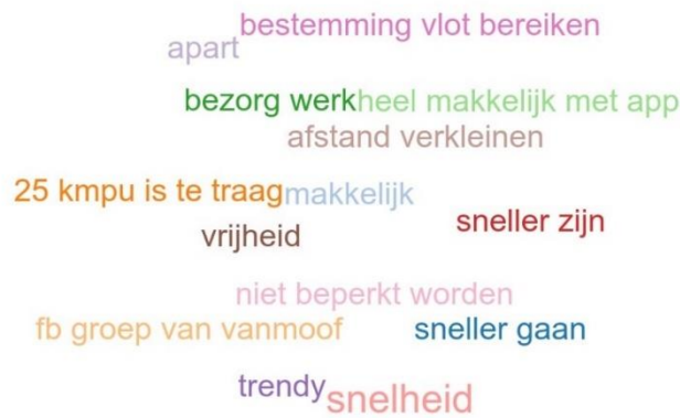
Figuur 3: Triggers woordenwolk groep 3 'hebben fiets opgevoerd'

De triggers zijn als volgt samen te vatten: