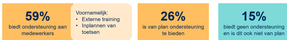
Figuur 3. De ondersteuning vanuit kinderopvangorganisaties richting pedagogisch medewerkers

de kinderopvangorganisaties tot op heden (nog) geen ondersteuning aan medewerkers. Een deel daarvan is dit wel van plan (zie figuur 3).