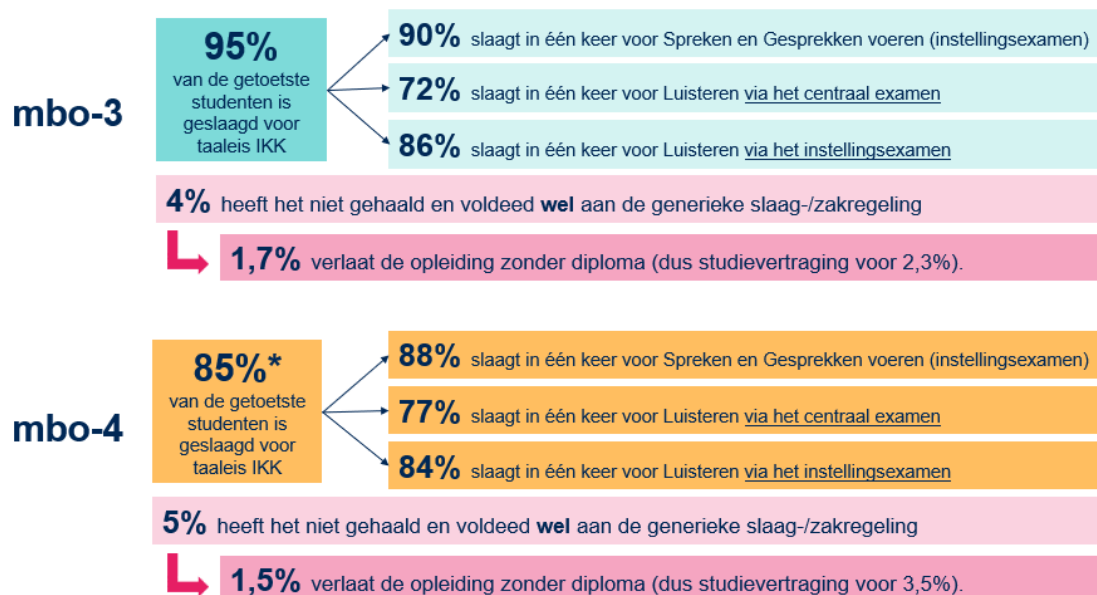
Figuur 4. Cijfermatige stand van zaken bij roc's op basis van de enquête. Cijfers hebben betrekking op het studiejaar 2022/2023 (* Zonder uitbijter: 92%)

Voor 4 - 5% van de studenten vormt de taaleis IKK het laatste obstakel in het afronden van hun opleiding. Zij voldeden in het studiejaar 2022/2023 wel aan de generieke diploma-eisen, maar niet aan de taaleis IKK. Als we dit extrapoleren naar het landelijke aantal getoetste studenten per jaar, dan halen circa 200 à 350 studenten per jaar de taaleis IKK niet, terwijl ze wel voldoen aan de generieke slaag-/zakregeling . Voor veel van hen resulteert dit in studievertraging. De groep die de opleiding verlaat zonder diploma valt hier ook onder (zie paragraaf 3.2.3).