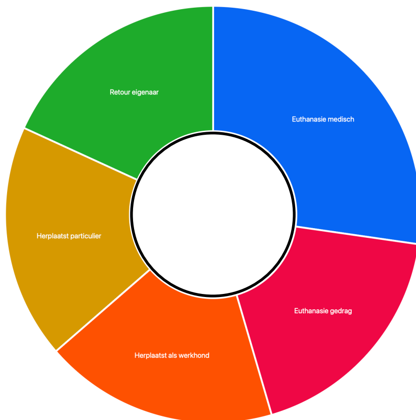
Figuur 9: uitkomst pilothonden