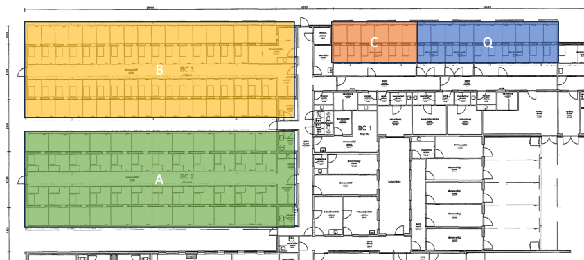
Figuur 3: Afdelingen binnen opvang

Binnen de verschillende afdelingen bevinden zich zowel prikkelarme als prikkelrijke kennels. Deze zijn opgedeeld in diverse compartimenten.