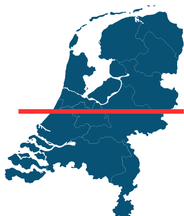
Figuur 1: Regio selectie pilothonden, ten zuiden van de rode lijn

Voor deze pilot hebben 11 honden het traject doorlopen. Er is geen specifieke selectie gemaakt van honden die in aanmerking kwamen voor de pilot. Alle 11 honden zijn strafrechtelijk in beslag genomen op grond van een bijtincident en direct na het incident in de pilot opgenomen. Tijdens de pilot was er ruimte voor 2-3 honden per keer. Wanneer er weer een plek vrij kwam voor een nieuwe pilot-hond, werd de eerstvolgende hond die in beslag werd genomen weer opgenomen. Omdat de HondenCampus in Tilburg is gevestigd, is er besloten qua afstand een grens te trekken van west naar oost ter hoogte van Den Haag vanwege de reistijd.