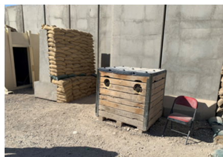
Afbeeldingen 2 en 3: Laad- en ontlaadinrichtingen parkeerplaats (links) en ingang Camp Bulldog (rechts).