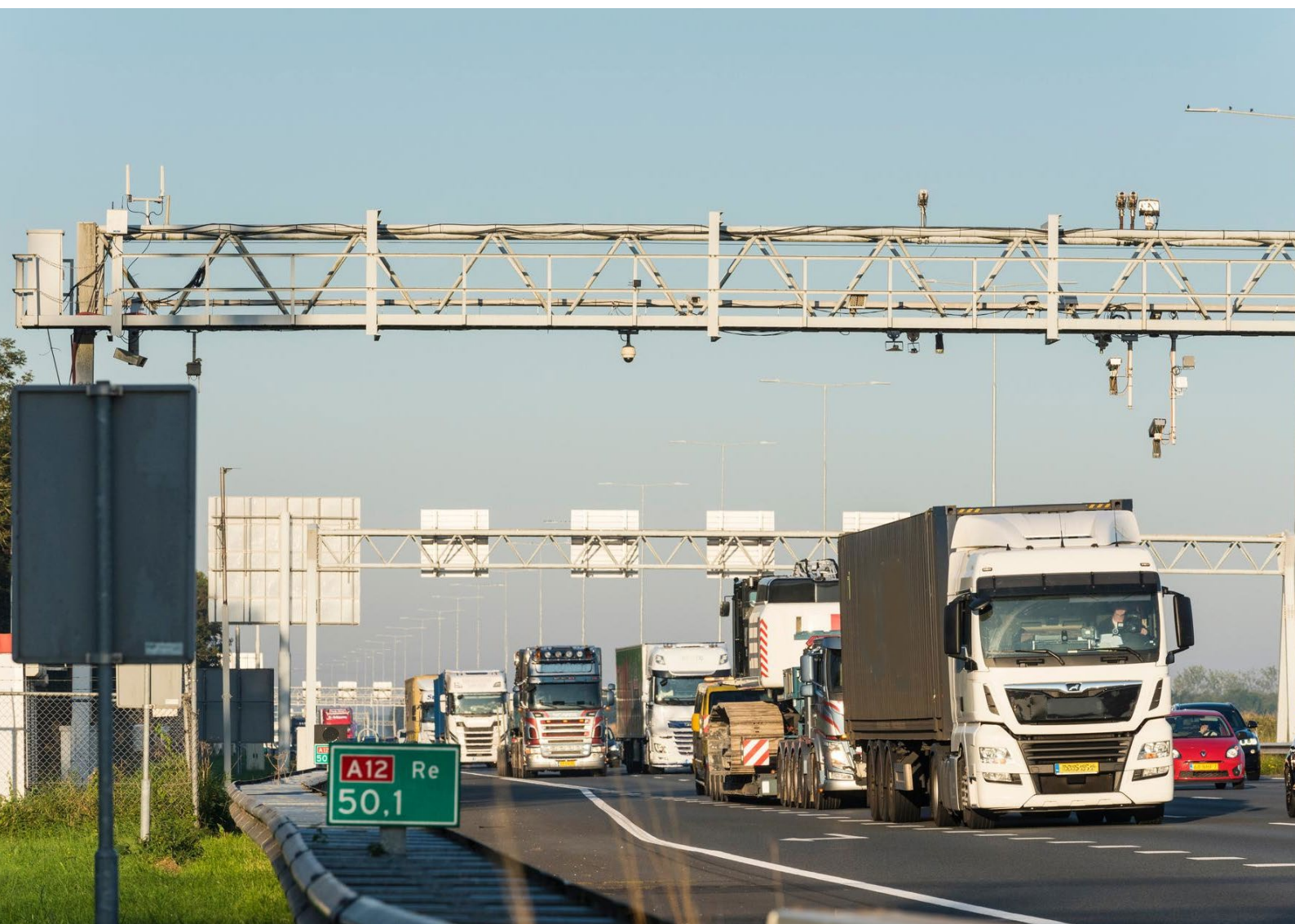
Foto 12: Cameraportaal boven de snelweg A12 bij Woerden. De netto-opbrengst van de vrachtwagenheffing wordt teruggesluisd voor innovatie en verduurzaming van de vervoerssector.

In 2030 zijn er naar verwachting ruim 14.000 emissievrije vrachtwagens extra, bovenop de zelfstandige groei van 13.000 emissievrije vrachtwagens. Daarnaast wordt 1 miljoen ton CO 2 bespaard, neemt de uitstoot van NO x met 675 ton af en vermindert de uitstoot van PM 10 met 19 ton. Als gevolg van de maatregelen voor logistieke efficiëntie worden er 90 miljoen voertuigkilometers minder gereden. Maar ook na 2030 hebben de maatregelen van het meerjarenprogramma nog effecten. Denk bijvoorbeeld aan voertuigen die pas in 2031 op de markt komen, maar wel al in 2030 via AanZET zijn aangeschaft. Of aan de vermindering van gereden kilometers door efficiëntie-inspanningen, die in 2030 of eerder zijn ingezet en waarvan de resultaten na 2030 nog merkbaar zijn. De effectstudie laat verder zien dat het emissievrije wagenpark pas na 2030 echt zal opschalen. Ook daarom zal het na 2030 wenselijk blijven om de verduurzaming van het wegvervoer via de terugsluis te stimuleren.