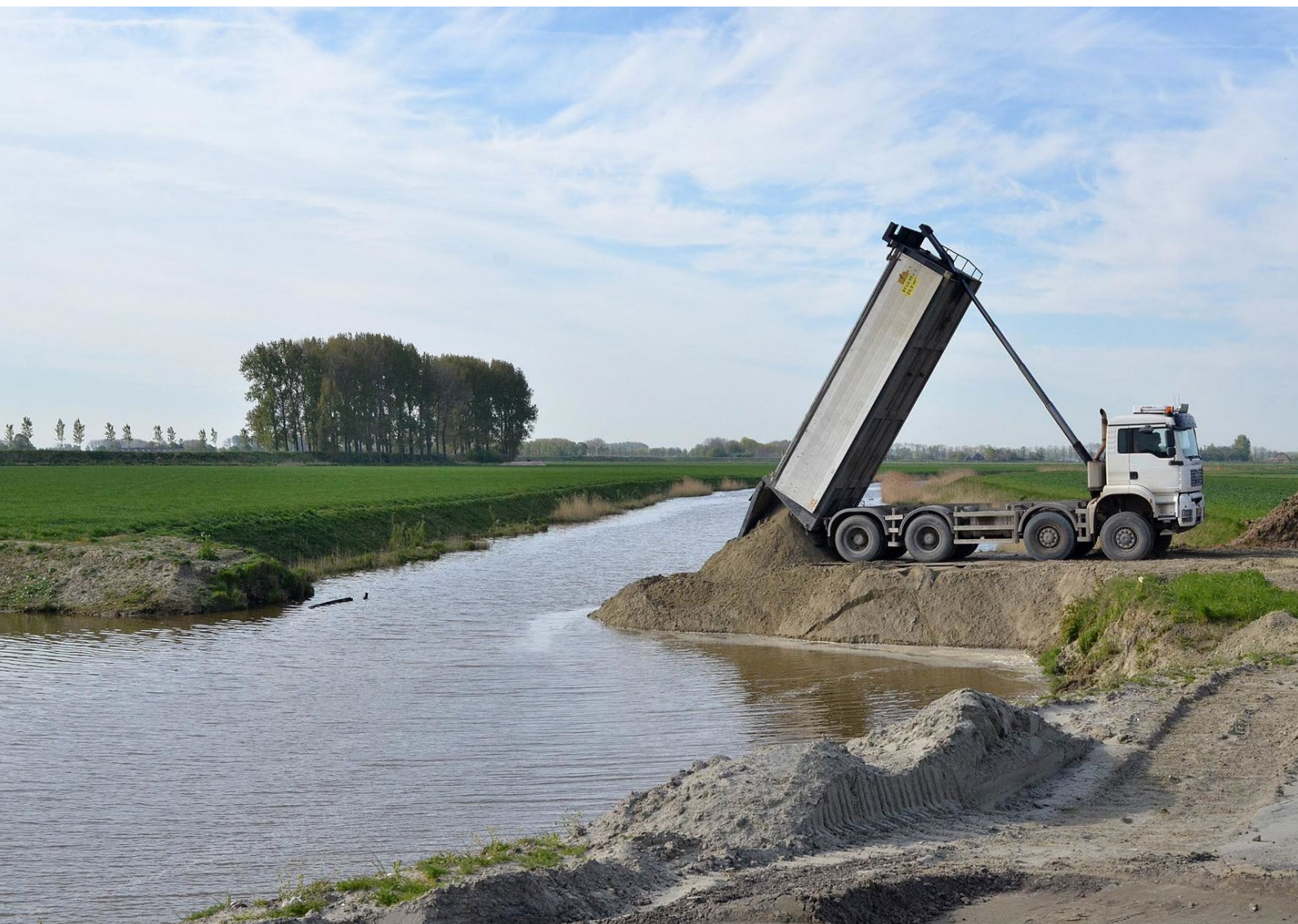
Foto 13: Een kiepwagen stort zand bij de N61. De maatregelen van de terugsluis worden nauwkeurig gemonitord en geëvalueerd.

Met behulp van deze gegevens wordt iedere maatregel elk jaar na de openstelling geëvalueerd om te bespreken of de maatregel het doel heeft bereikt en hoe effectief de maatregel is geweest. Dan komen vragen aan bod als: hoe groot was de belangstelling? Hoeveel budget is gebruikt? Zijn er dingen die een volgende keer beter anders kunnen? Zo kan bijvoorbeeld worden bepaald of een maatregel misschien extra aandacht nodig heeft, of juist zo populair is dat deze eerder gesloten moet worden, omdat het budget al vergeven is.