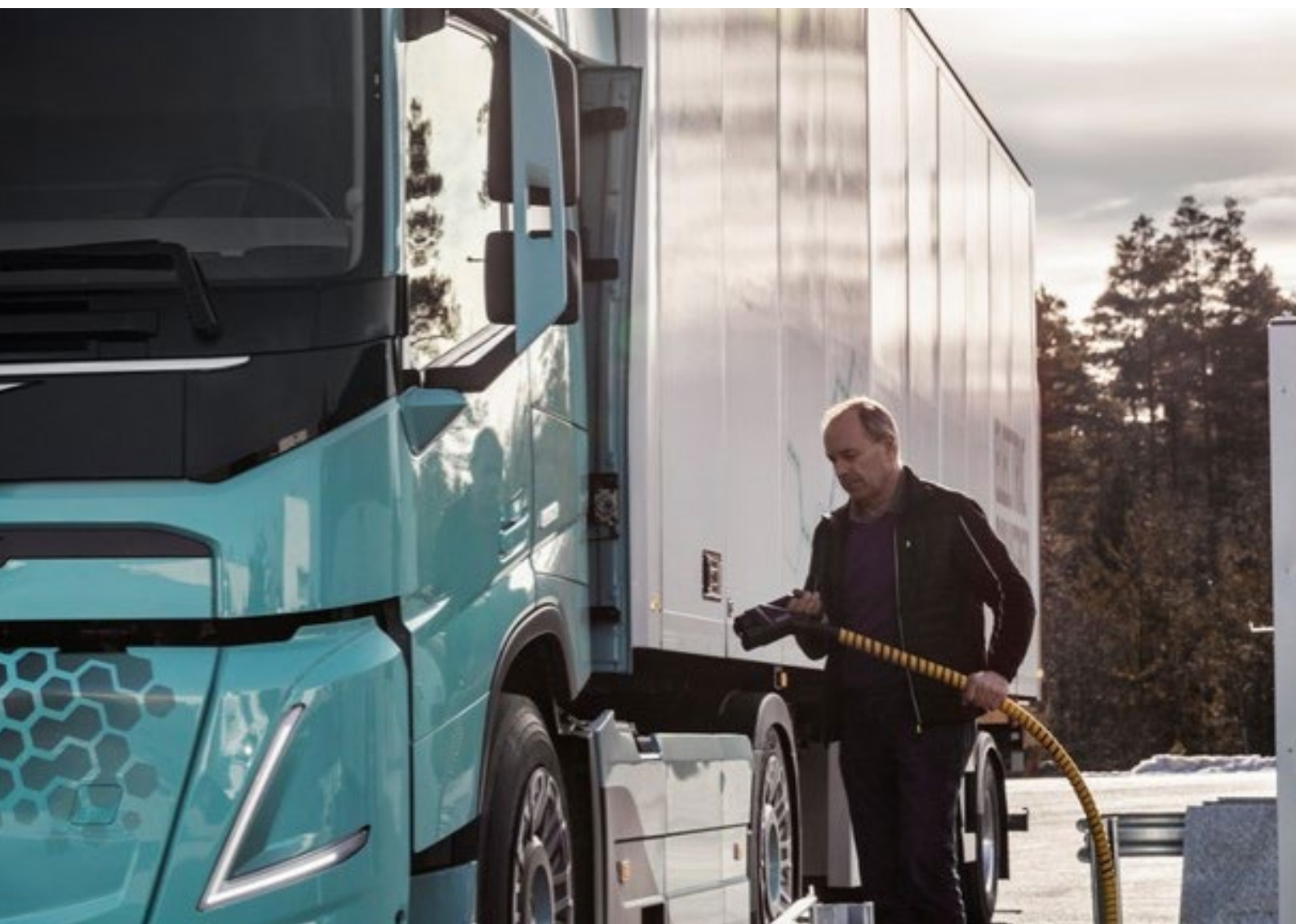
Foto 7: Een vrachtwagenchauffeur koppelt zijn elektrische vrachtwagen aan om bij te laden.

Hieronder worden deze maatregelen toegelicht.