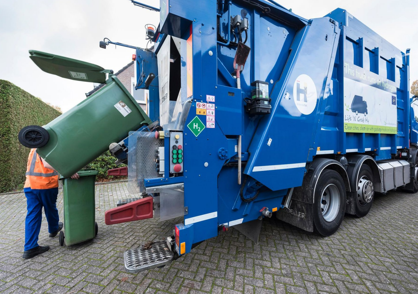
Foto 8: Een vuilniswagen op waterstof haalt groenafval op in Best. De wagen tankt eenmaal per dag (waterstof).