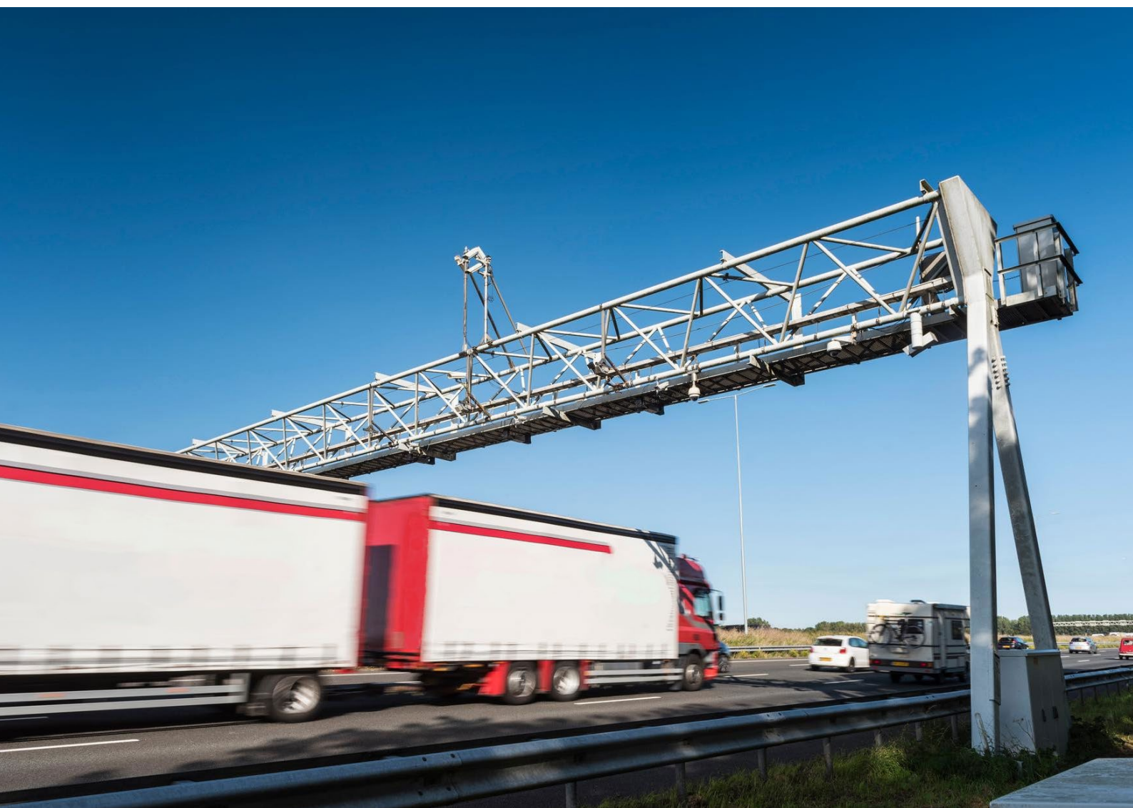
Foto 6: Cameraportaal boven de snelweg A12 bij Woerden. De proefopstelling test meetinstrumenten en scanapparatuur.

De meeste reacties steunden het concept-meerjarenprogramma en beoordeelden de subsidies als positief en noodzakelijk. Diverse reacties benadrukten dat de overgang naar emissievrij wegtransport voor veel ondernemers niet haalbaar is zonder financiële steun, omdat de kosten voor elektrische of waterstofvrachtwagens erg hoog zijn. Meerdere indieners vroegen nadrukkelijk aandacht voor de positie van het midden- en kleinbedrijf (mkb). Er is een verslag van de opbrengst van de internetconsultatie gemaakt, inclusief reactie van het ministerie.