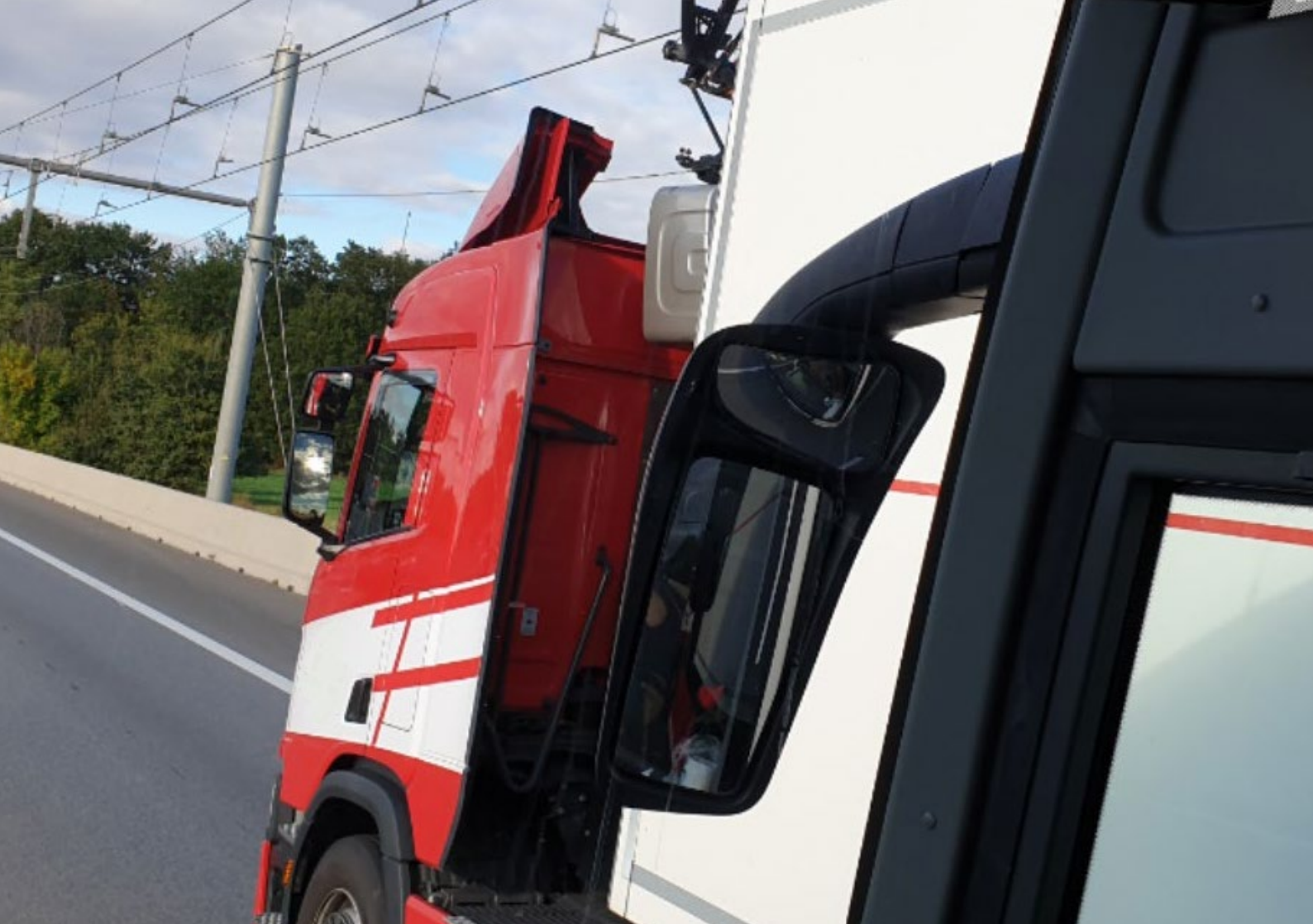
Foto 9: Een vrachtwagen laadt al rijdend op via een bovenleiding, met behulp van Electric Road Systems (ERS).