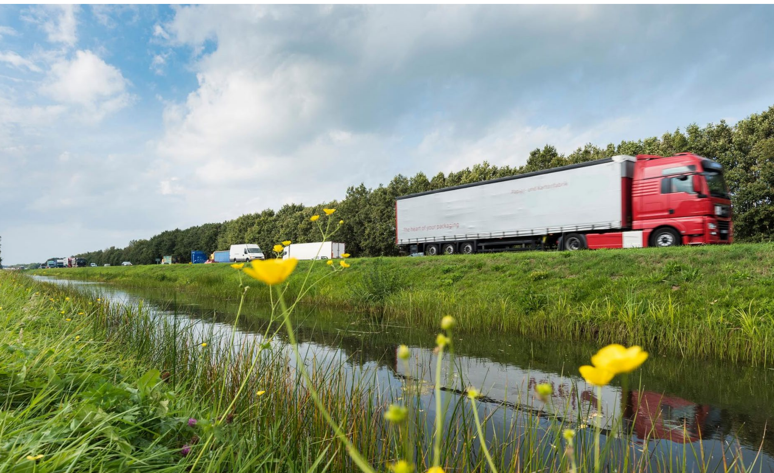
Foto 3: Vrachtwagen bij Abcoude. Straks gaat binnenlands en buitenlands vrachtverkeer betalen voor het gebruik van de weg.