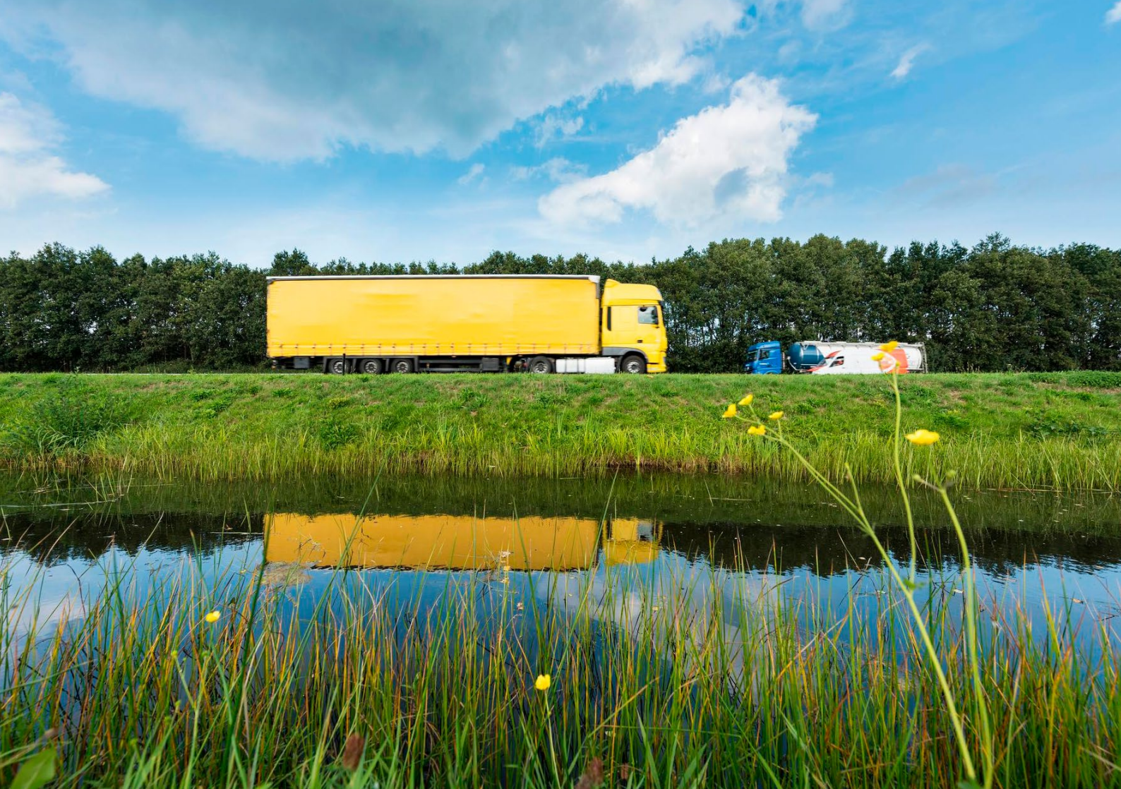
Foto 14: Vrachtwagen op de snelweg A28 ten zuidwesten van Hoogeveen. Het is belangrijk te volgen of de verschillende maatregelen het effect hebben dat wordt verwacht.