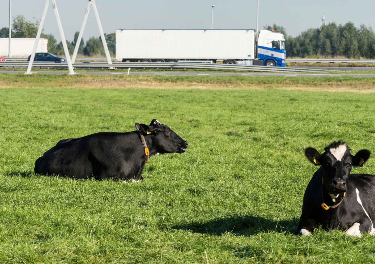
Foto 4: Vrachtwagen bij Reijerscop. Om betalen per gereden kilometer mogelijk te maken verandert de vaste belasting naar een variabele heffing.