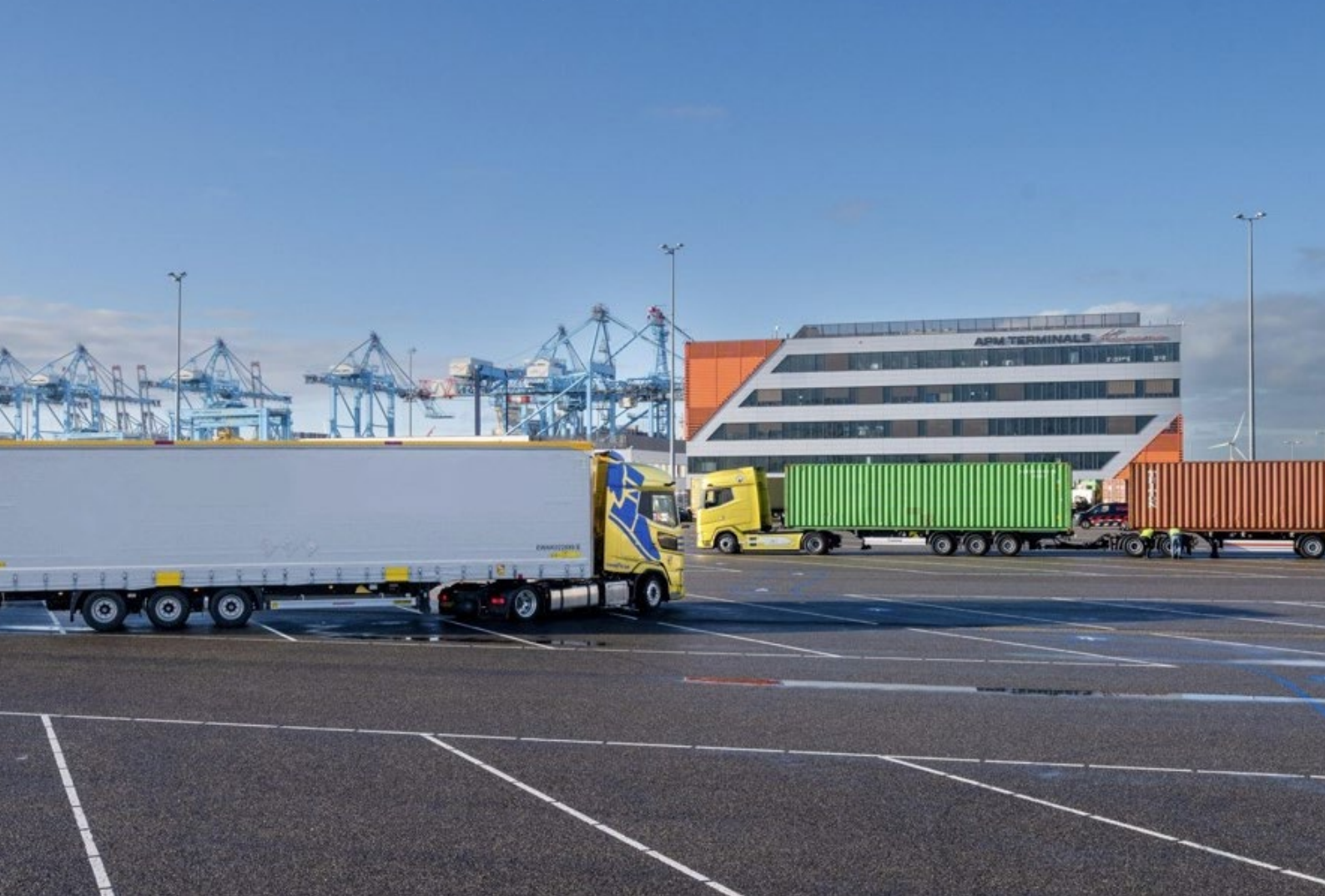
Foto 11: Twee Super-Ecombi's reden een parcours tijdens de SEC Experience Day in Rotterdam.

In 2024 is een inventarisatie gemaakt van relevante projecten binnen het ministerie van IenW. Hieruit wordt een aantal projecten gekozen die gericht zijn op logistieke efficiëntie, die vanuit de terugsluis opnieuw budget krijgen. Doel van deze maatregel is om stilgevallen projecten weer vlot te trekken en financiering voor de lange(re) termijn te bieden.