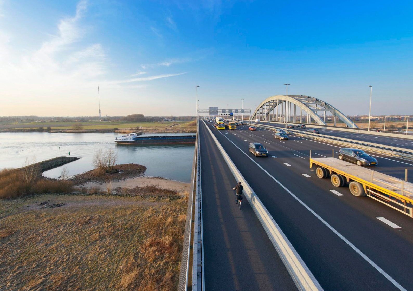
Foto 10: Vrachtwagen met lege oplegger op de Jan Blankenbrug over de Lek (A2).

Deze maatregelen zijn onder andere gebaseerd op de aanbevelingen uit rapporten van Ecorys (2021) en CE Delft (2023) . Ook is gebruik gemaakt van de kennis en ervaring van onder andere de vervoerspartijen, TKI Dinalog, Connekt en Topsector Logistiek. De doelgroep van deze maatregelen is de hele logistieke wegtransportsector: transportondernemingen én verladers.