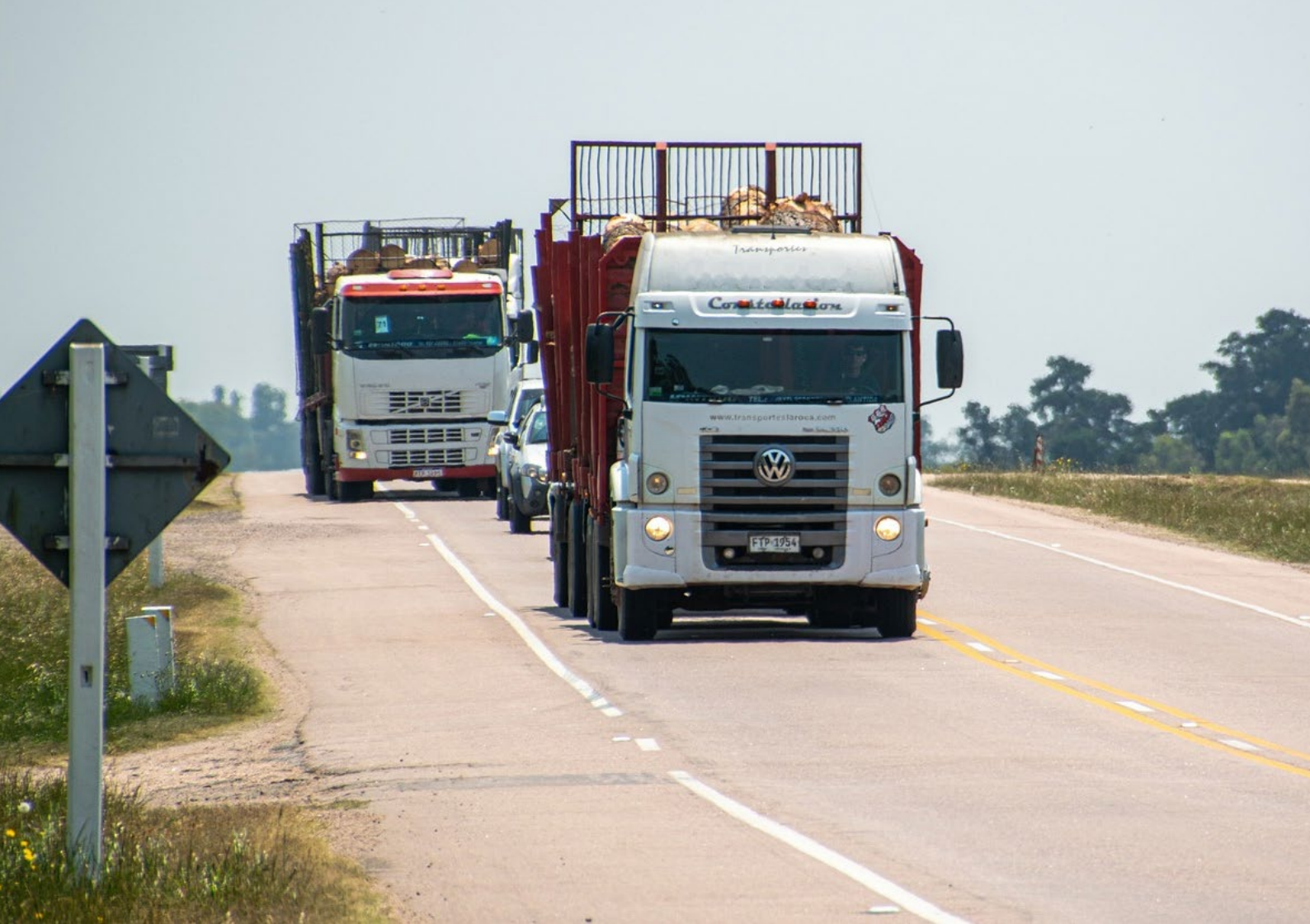
Foto 5: De netto-opbrengst uit de vrachtwagen-heffing wordt teruggesluisd voor innovatie en verduurzaming van de vervoerssector.