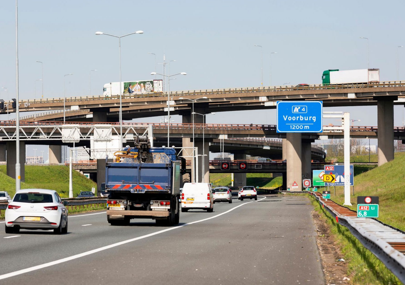
Foto 2: Verkeer bij het knooppunt Prins Clausplein bij Voorburg. De terugsluis is vormgegeven na overleg met de vervoerssector.