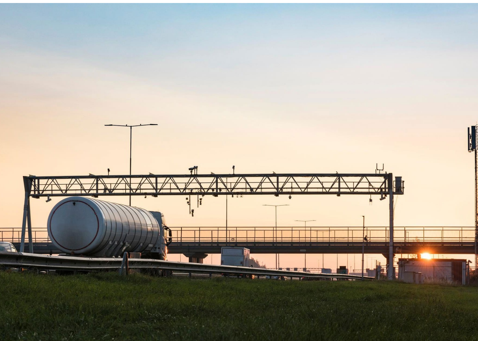
Foto 15: Cameraportaal boven de snelweg A12 bij Woerden. De vrachtwagenheffing draagt bij aan een toekomstbestendige vervoerssector.

Deze vijfjarige evaluatie sluit aan bij de wettelijke plicht. Zo staat in de Wet vrachtwagenheffing dat de Minister van IenW periodiek een verslag aan de Staten-Generaal moet sturen over de doeltreffendheid en de effecten van de vrachtwagenheffing en maakt artikel 12 duidelijk dat deze evaluatieplicht ook voor de terugsluis geldt.