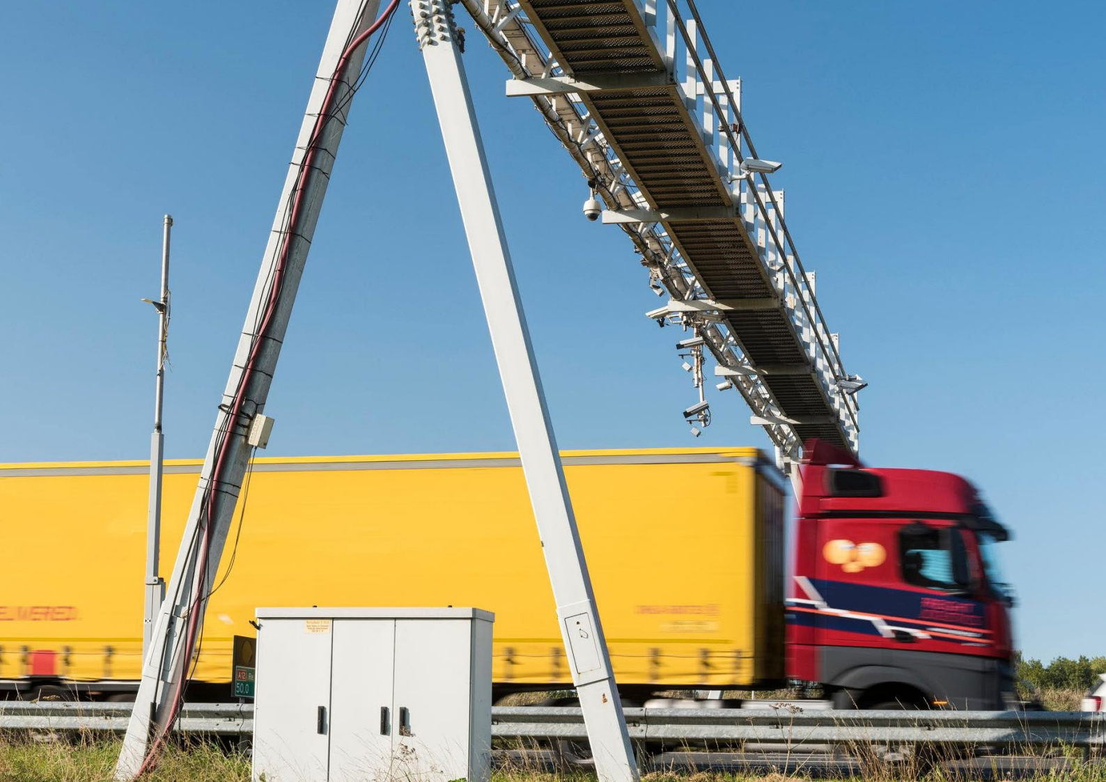
Foto 1: Cameraportaal boven de snelweg A12 bij Woerden, in een proefopstelling voor de vrachtwagenheffing.