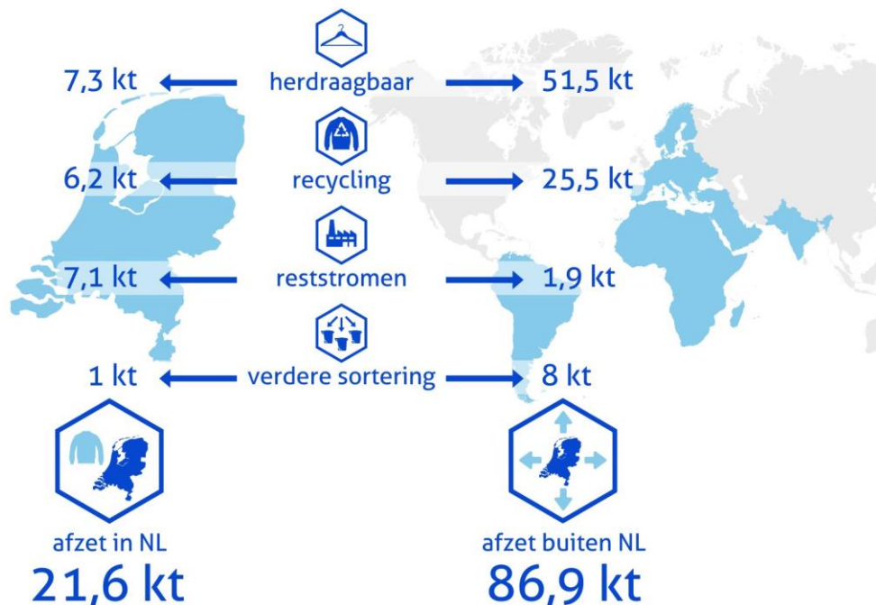
Figuur 3: Massabalans 2022 (gewicht, route) van in Nederland ingezameld afgedankt textiel

In onderstaand figuur is de afzet verdeeld naar binnen en buiten Nederland.