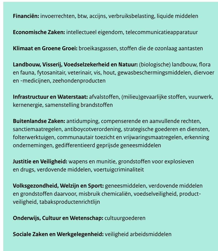
Figuur 1: Opdrachtgevende ministeries