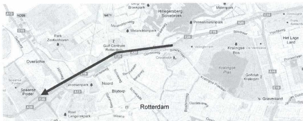
Figuur 1: 80 km/h zone A20 Rotterdam

In een voor- en na onderzoek zijn de effecten vastgesteld op basis van gemeten gedragsveranderingen van het verkeer.