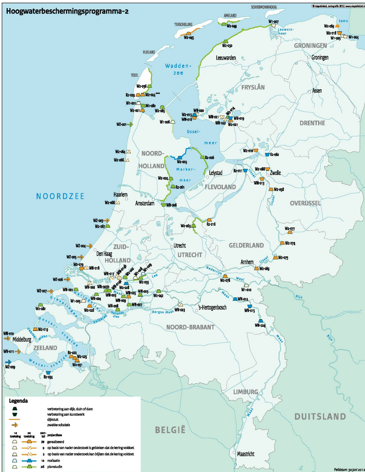
Actuele scope van het programma, peildatum 30 juni 2012.